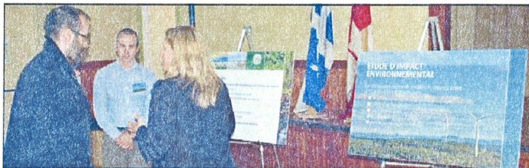
Des représentants de la compagnie Innergex étaient sur place pour répondre aux interrogations des gens.

Le projet du Parc éolien Viger-Denonville impliquant à parts égales la MRC de Rivière-du-Loup et la compagnie Innergex, a franchi une autre étape la semaine dernière avec la tenue de deux séances d'information publiques à Saint-Paul-de-la-Croix et Saint-Épiphane, les deux municipalités où seront construites 12 éoliennes d'une capacité de production de 24,6 mégawatts en terres privées, de quoi alimenter 4 000 résidences privées.