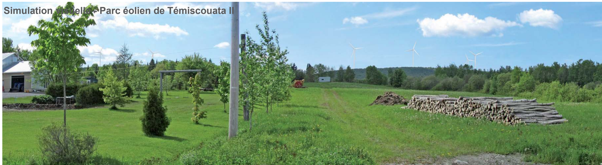
Simulation visuelle - Parc éolien de Témiscouata II