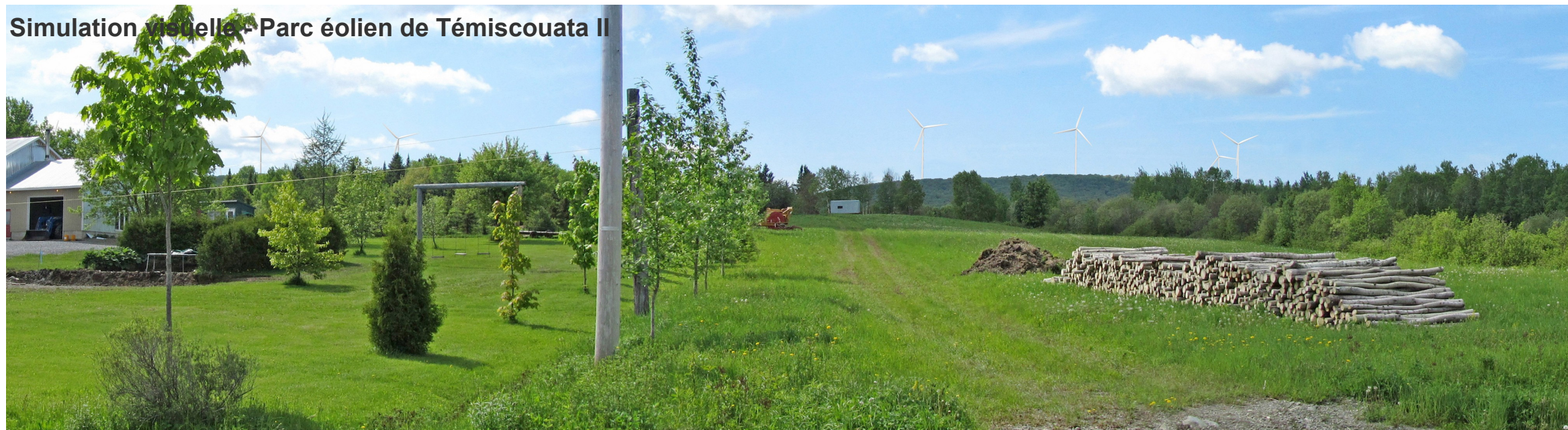
Simulation visuelle - Parc éolien de Témiscouata II