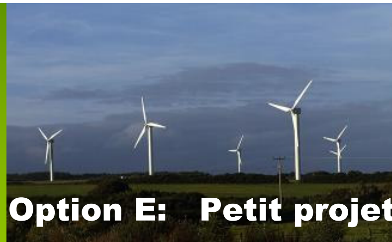
Option E: Petit projet