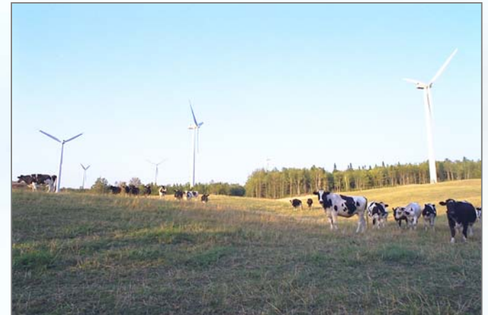
Le Nordais, Canada