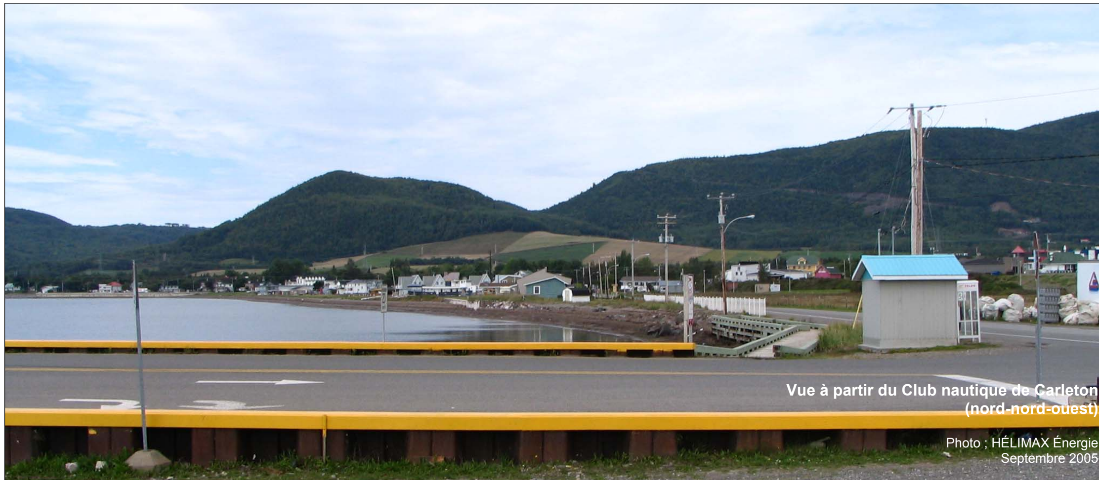
Vue à partir du Club nautique de Carleton (nord-nord-ouest)