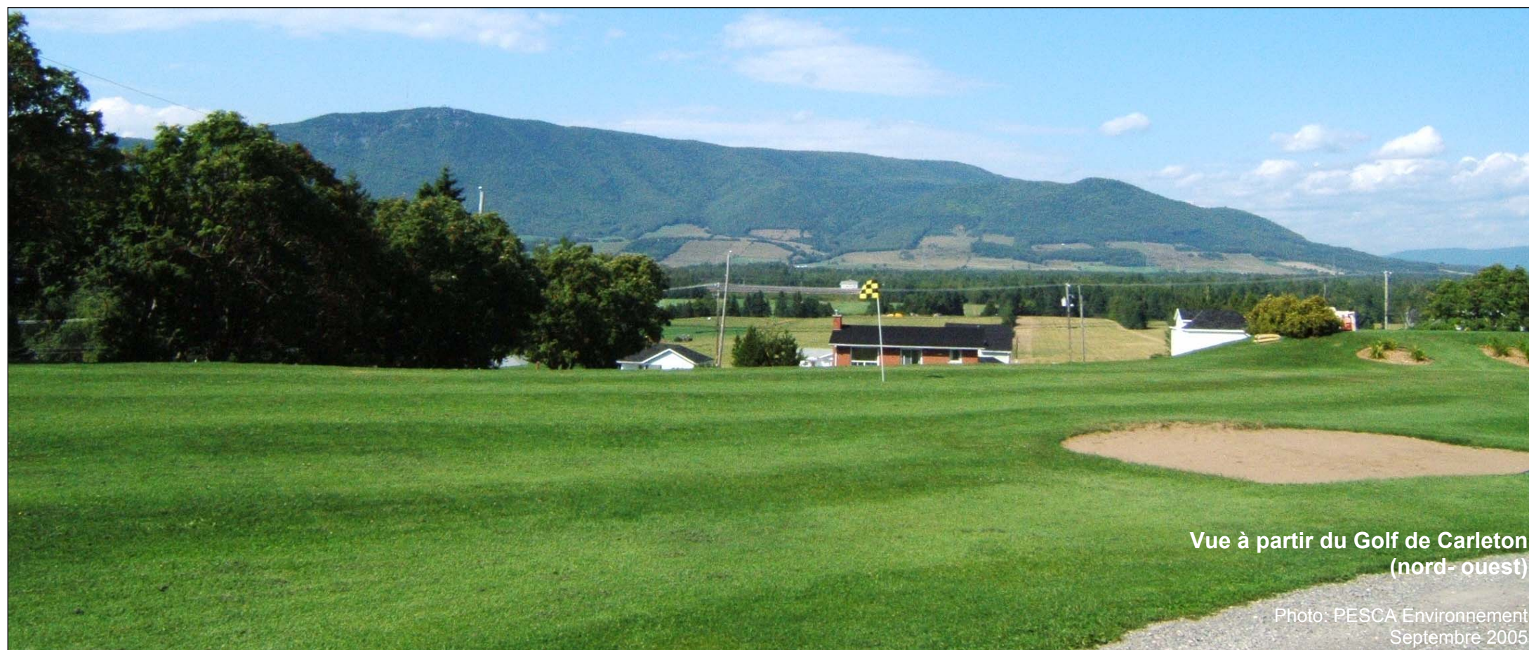
Vue à partir du Golf de Carleton (nord-ouest)

Photo: PESCA Environnement Septembre 2005