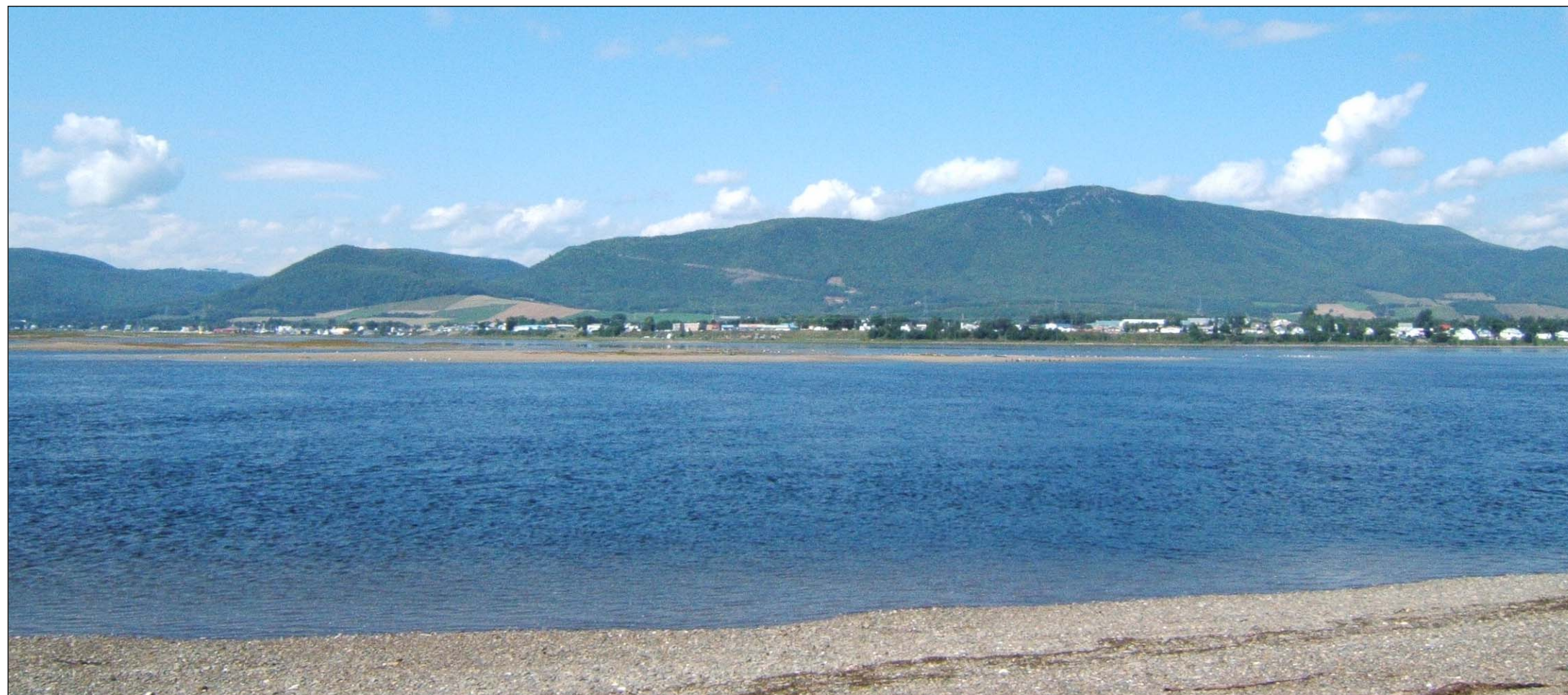
Montage 3 Prises de vue en direction du parc éolien (aucune éolienne visible)