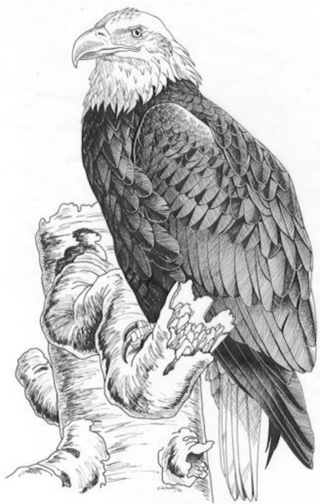
Figure 1. Le pygargue à tête blanche adulte.

La première section du plan de rétablissement présente la mise à jour des informations mentionnées dans un rapport sur la situation du pygargue à tête blanche au Québec publié par le ministère de l'Environnement et de la Faune (MEF) en 1996 (Lessard 1996). La deuxième section présente quant à elle les actions à mettre en œuvre.