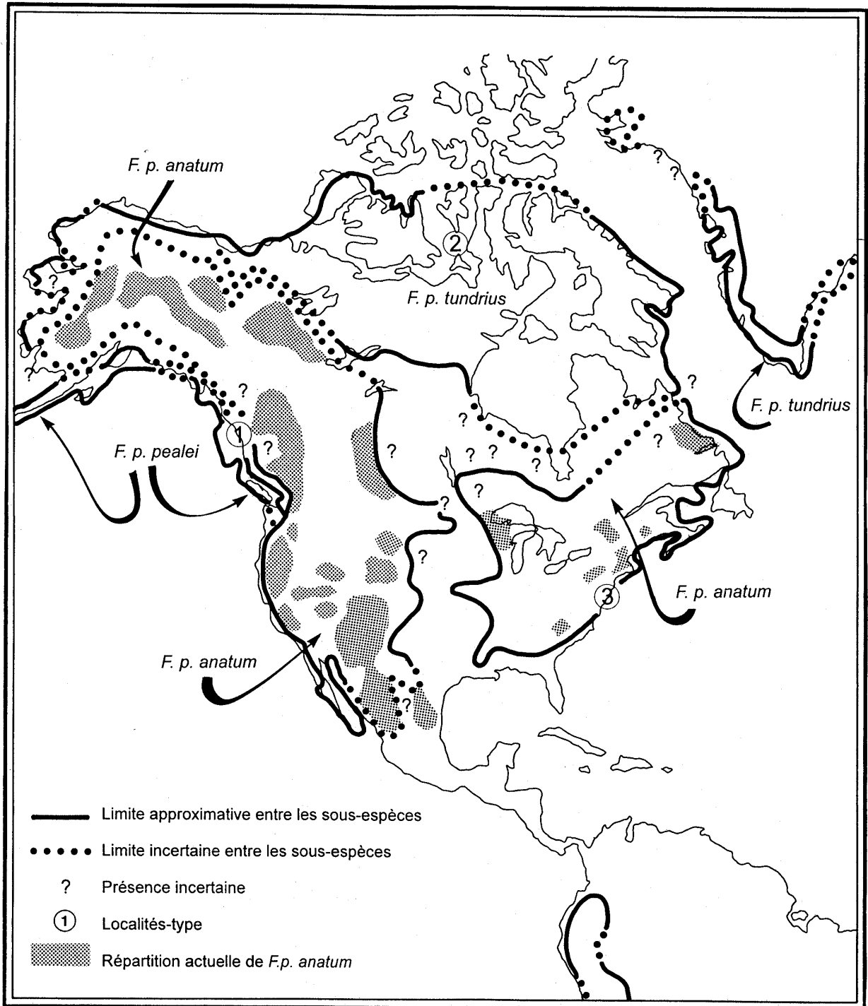
Figure 1. Répartition des trois sous-espèces de faucons pèlerins ( Falco peregrinus ) en Amérique du Nord (selon White et Boyce 1988).