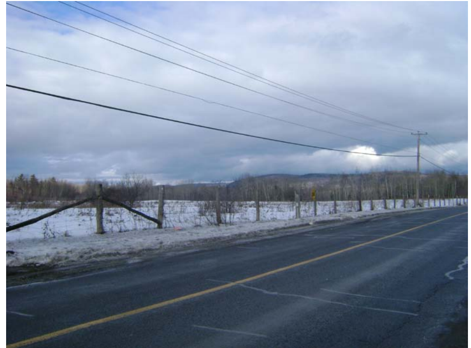
Photographie #20 Aperçu de l'unité de paysage 36- Vue direction nord-ouest à partir du chemin Vanier.