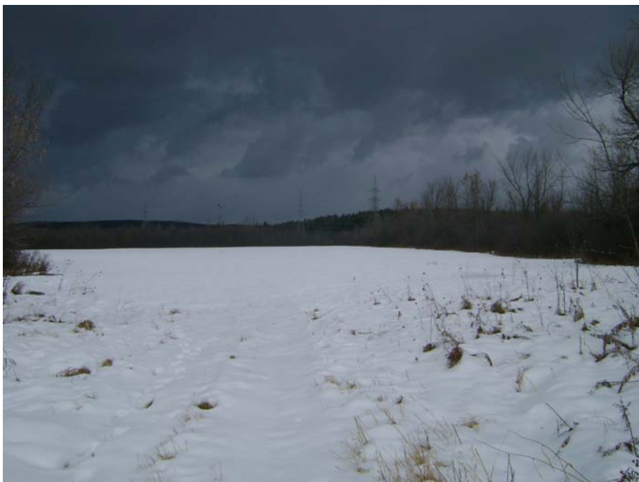
Photographie #7 Aperçu de l'unité de paysage 13 – Vue en direction nord à partir du chemin Pink.