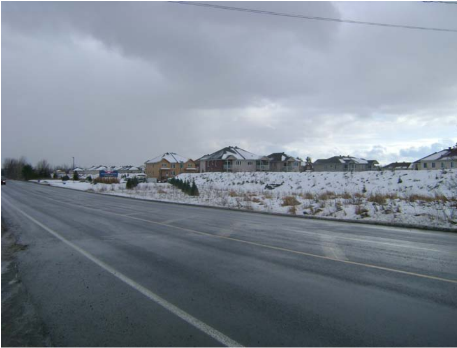
Photographie #5 Aperçu de l'unité de paysage 9 – Vue en direction sud-est à partir du chemin Pink à l'ouest de la rue Vernon