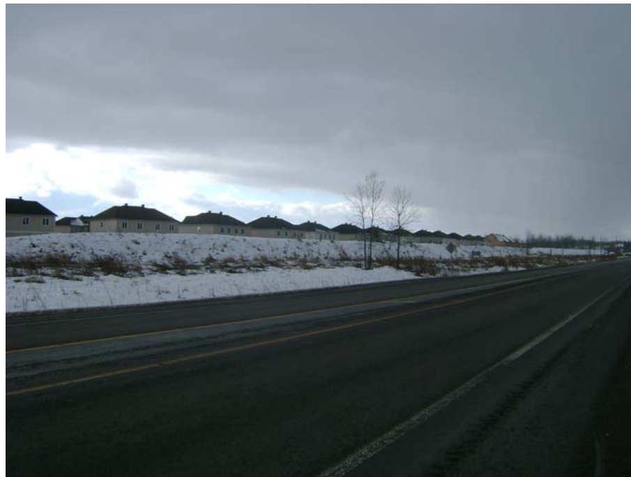
Photographie #4 Aperçu de l'unité de paysage 9 - Vue en direction sud-ouest à partir du chemin Pink à l'ouest du Boulevard de l'Europe