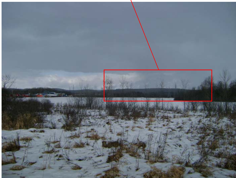
Photographie #11 Aperçu de l'unité de paysage 11 – Vue en direction nord à partir du chemin Pink.