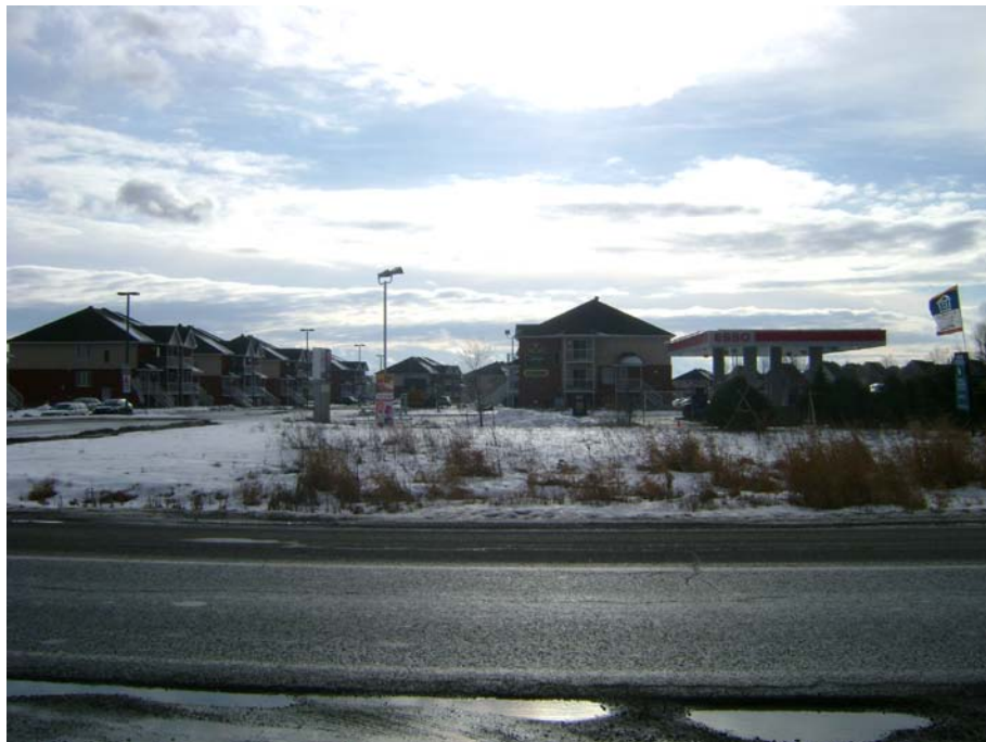
Photographie #3 Aperçu de l'unité de paysage 9 - Vue en direction sud à l'intersection du chemin Pink et du Boulevard des Grives