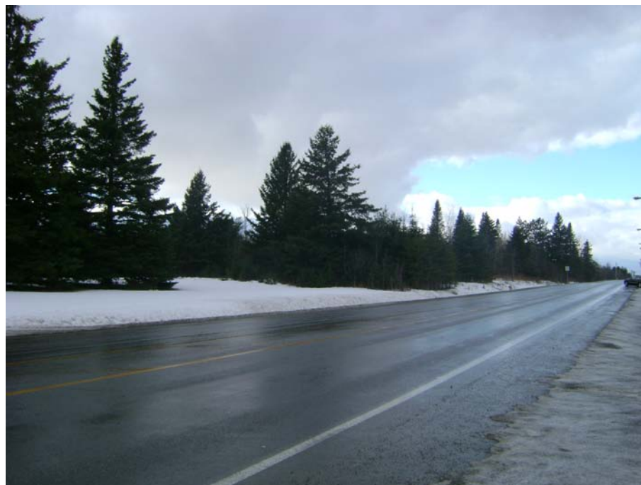
Photographie #16 Aperçu de l'unité de paysage 7- Vue direction sud-ouest à partir du chemin Pink.