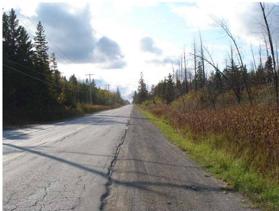
Photographie #22 Aperçu de l'unité de paysage 1- Vue direction ouest à partir du chemin Pink, à l'ouest du chemin Vanier.