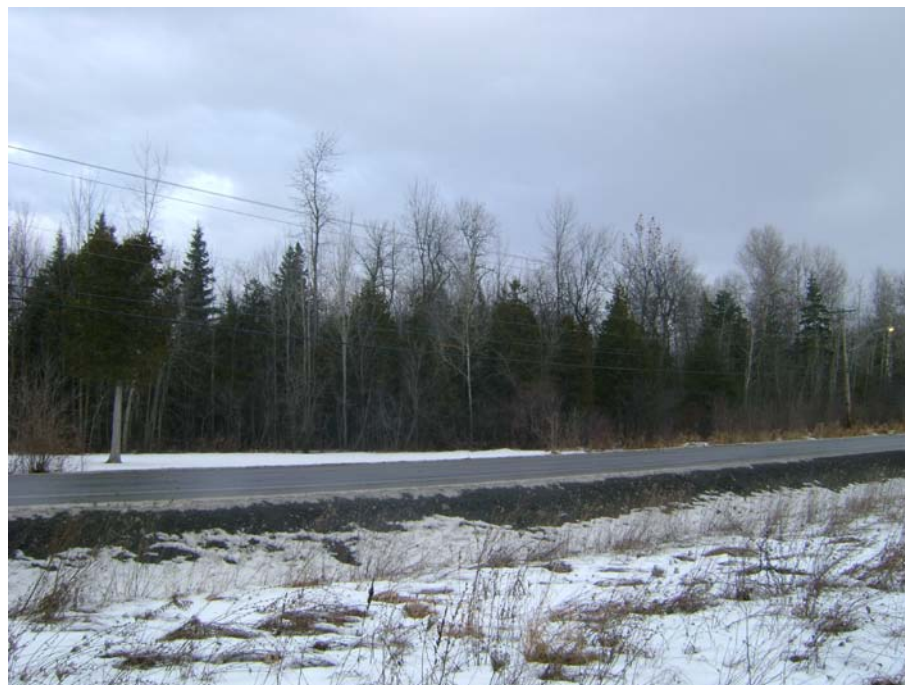
Photographie #14 Aperçu de l'unité de paysage 6- Vue en direction nord à partir du chemin Pink.