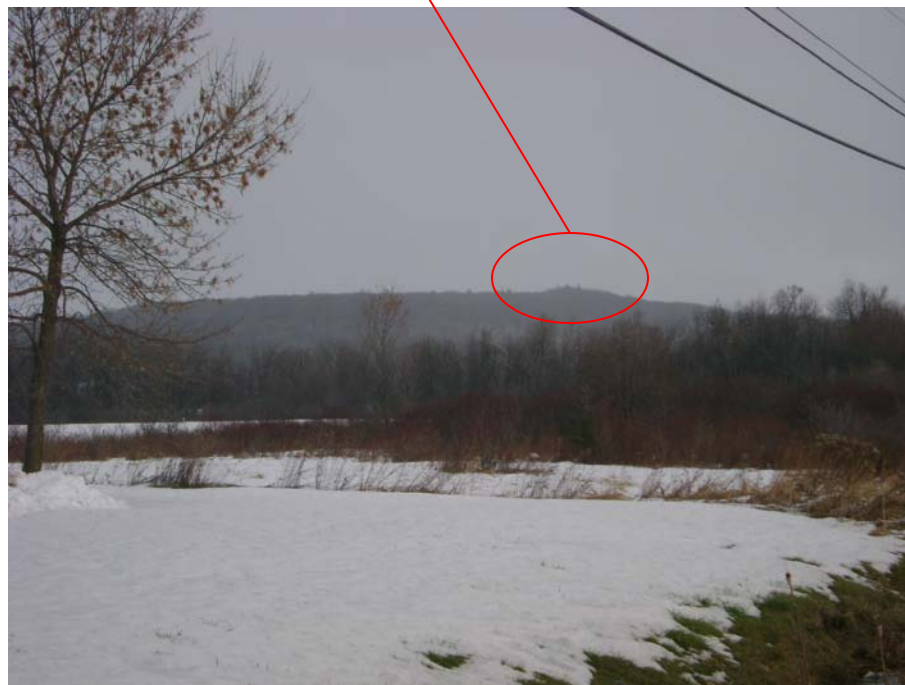
Photographie #12 Aperçu de l'unité de paysage 11- Vue direction nord-est vers le point de repère (parc de la Gatineau) à partir du chemin Pink.