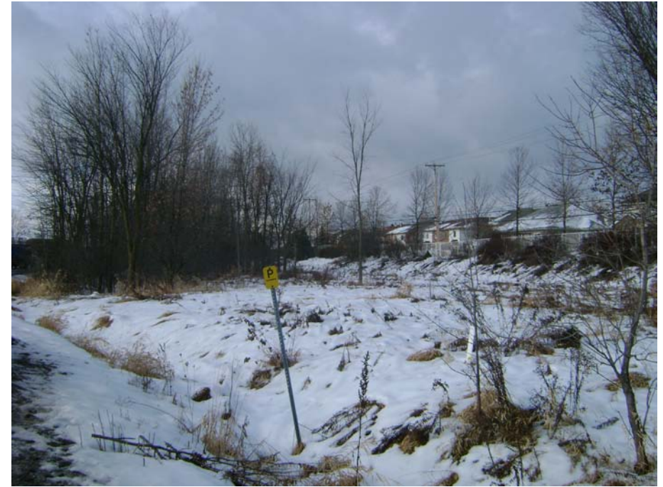
Photographie #6 Aperçu de l'unité de paysage 14 – Vue en direction nord-ouest à partir du chemin Pink au croisement de la rue de la Gravité.