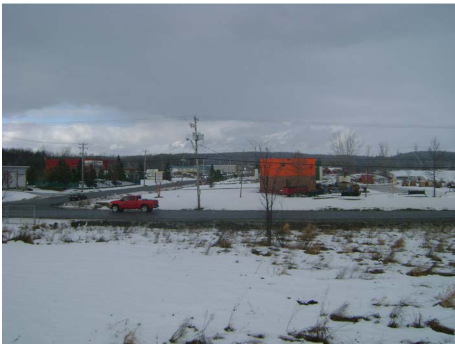
Photographie #13 Aperçu de l'unité de paysage 10 – Vue en direction nord à l'intersection du chemin Pink et la rue Vernon.