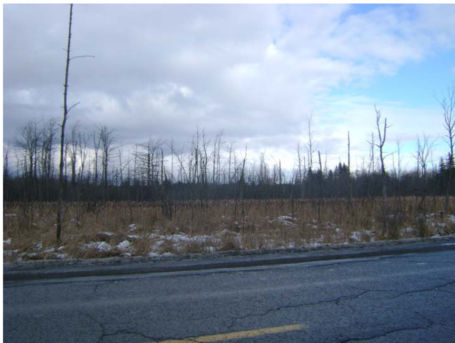
Photographie #21 Aperçu de l'unité de paysage 1 – Vue en direction nord-ouest à partir du chemin Pink à l'ouest du chemin Vanier.