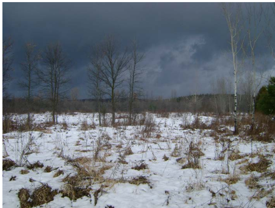
Photographie #8 Aperçu de l'unité de paysage 13- Vue direction nord à partir du chemin Pink.