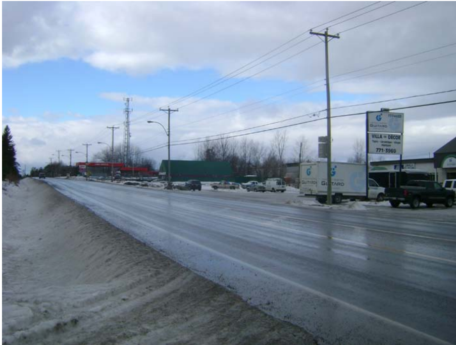
Photographie #19 Aperçu de l'unité de paysage 5 – Vue en direction nord-ouest à partir du chemin Pink à l'est du chemin Vanier.