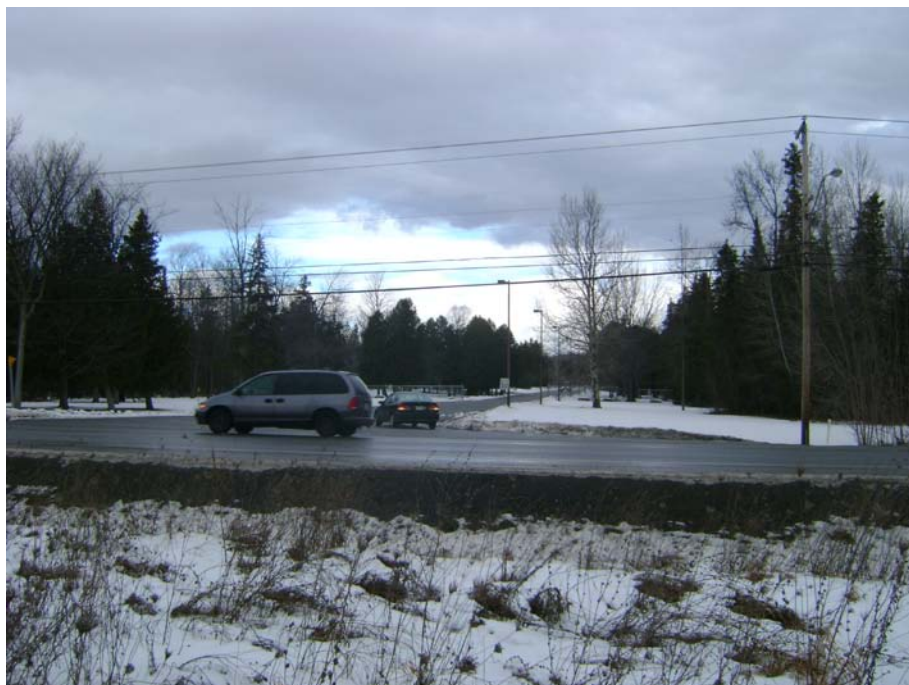
Photographie #15 Aperçu de l'unité de paysage 6 – Vue en direction nord à partir du chemin Pink, en face du 1770 chemin Pink.