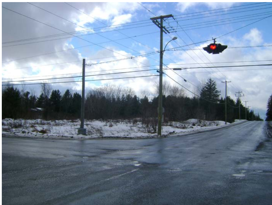
Photographie #17 Aperçu de l'unité de paysage 2 – Vue en direction sud-ouest à l'intersection du chemin Pink et du chemin Vanier.