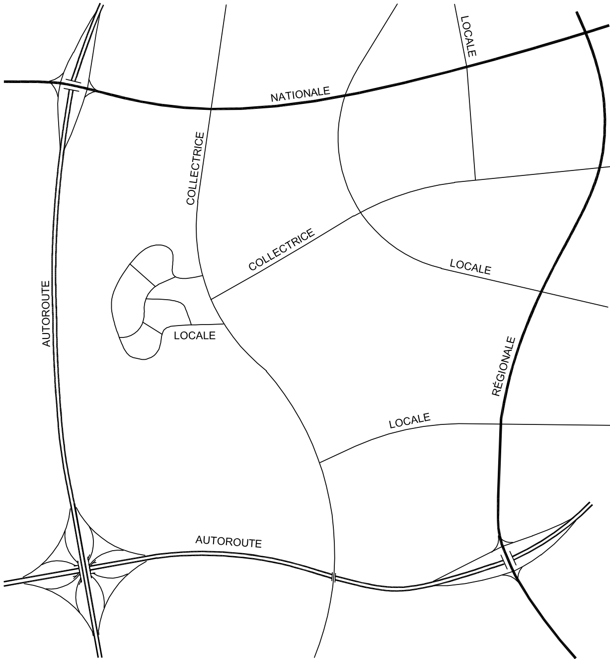
Figure 1.4-1 Raccordements théoriques entre les classes de routes