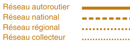
Figure 1.3-1 Classification fonctionnelle du réseau routier, MRC d'Arthabaska (mars 2001)