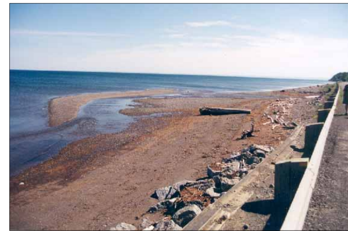
VUE VERS L'OUEST