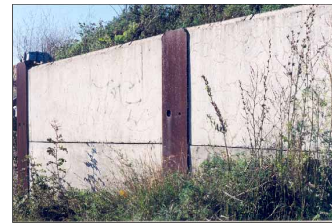
BERLINOIS EN BÉTON