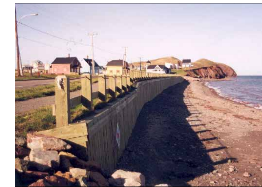
PALPLANCHE RECOUVERT DE BOIS