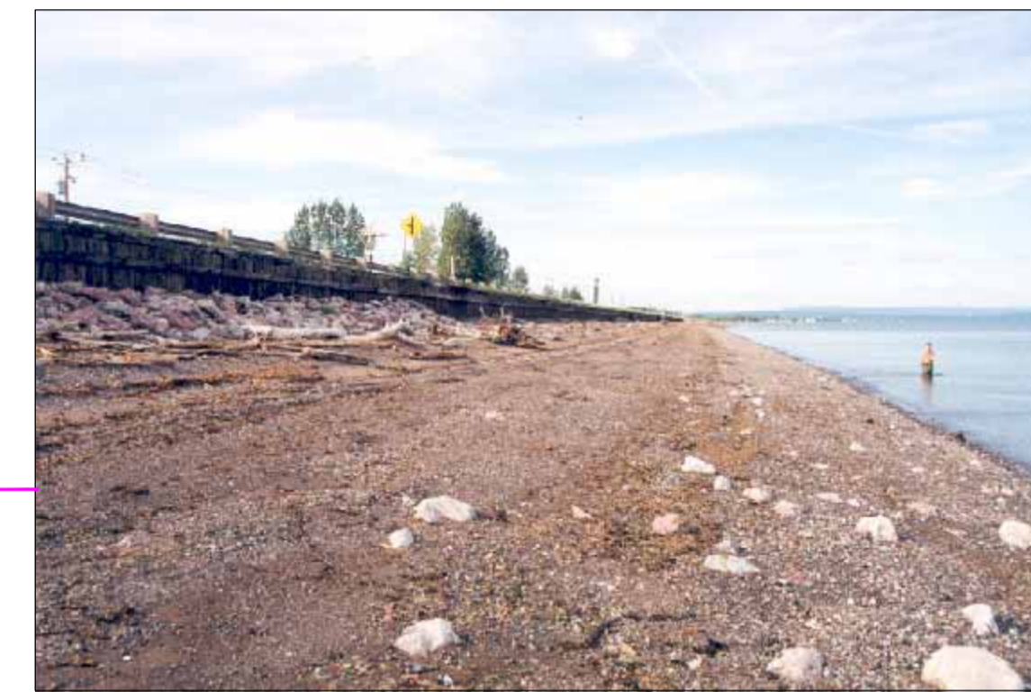
VUE VERS L'EST