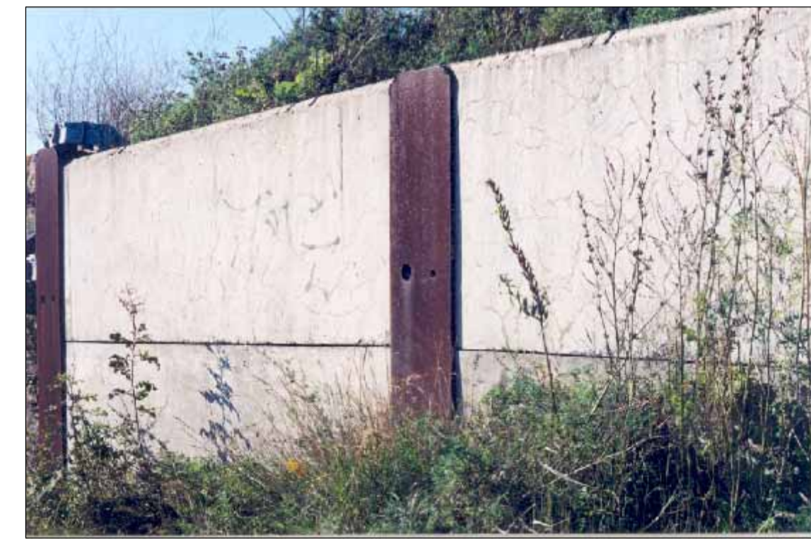
BERLINOIS EN BÉTON