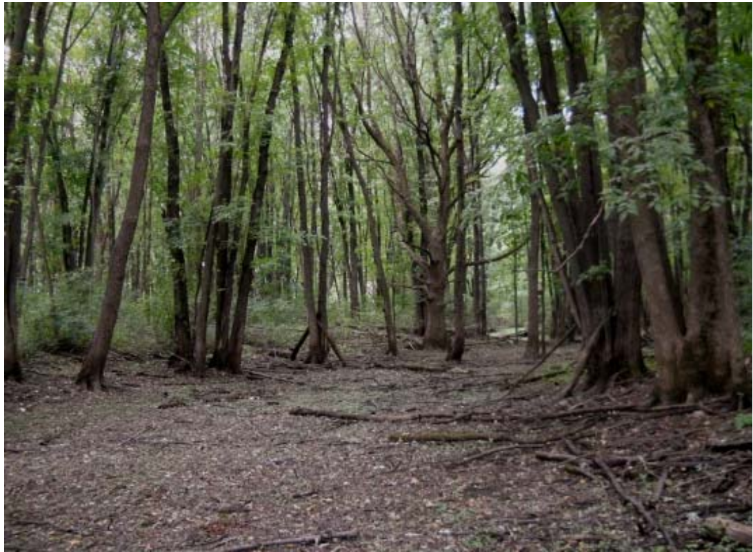
ph 3 : Nord de la rue Bienville