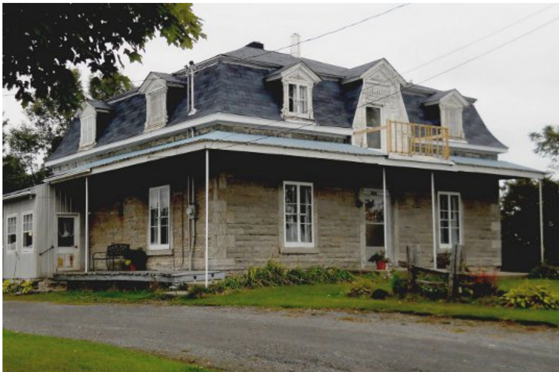
ph 12 : 2985 des Perron