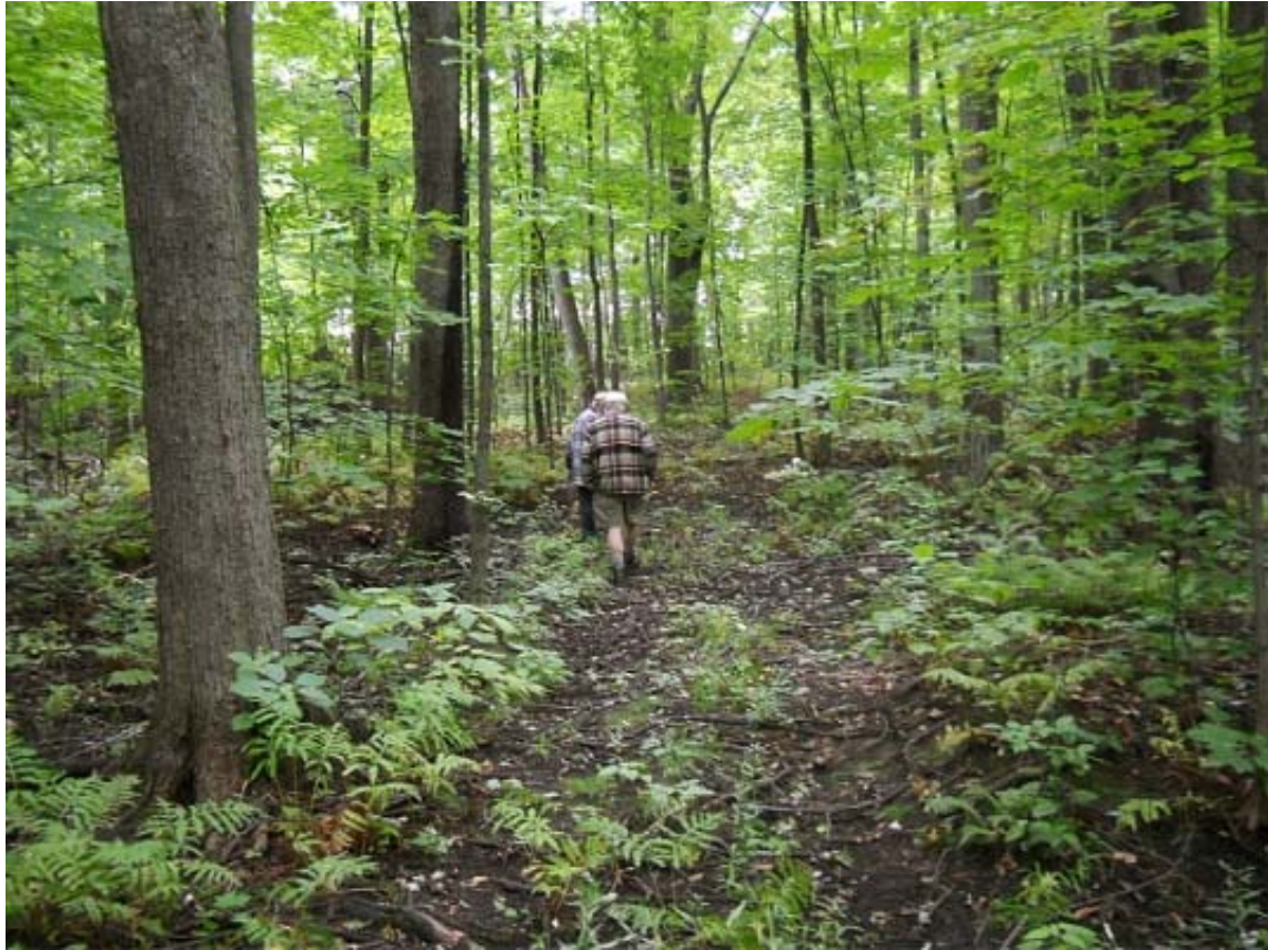
ph 11 : Érablière sur le passage de l'échangeur Saint-Saens projeté