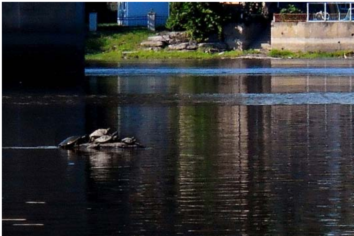
ph 1 :Tortues sous le pont David