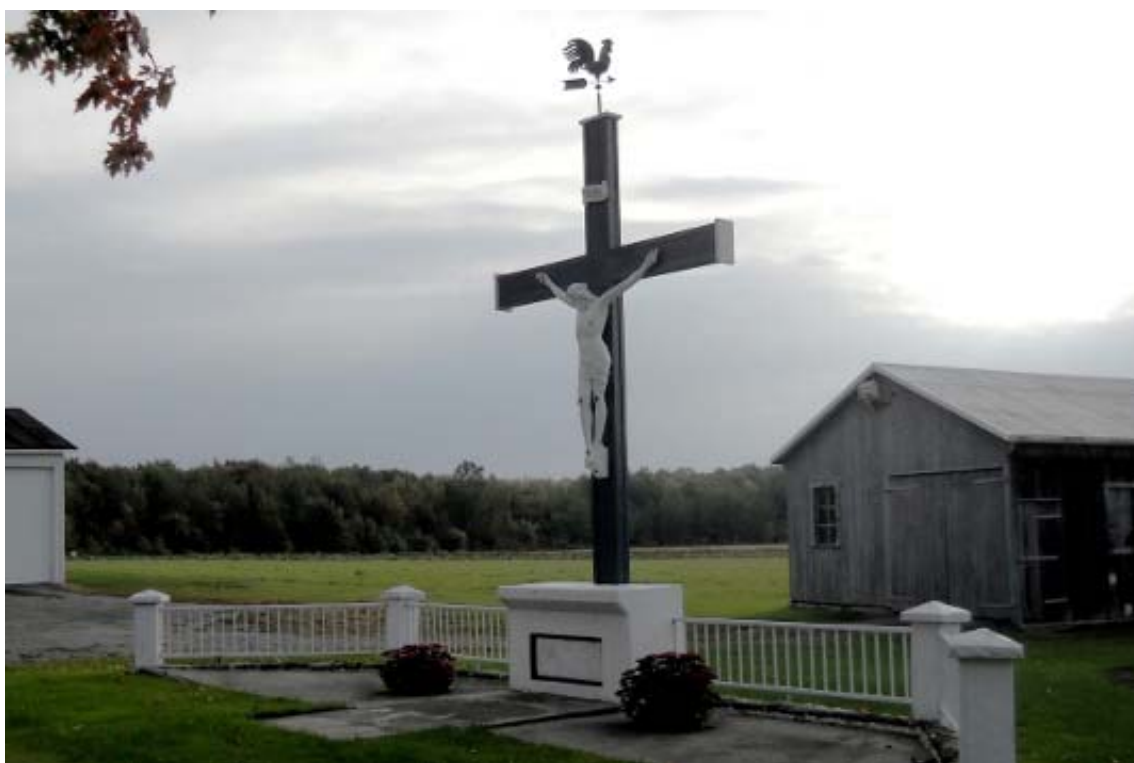
ph 14 : Calvaire sur l'avenue des Lacasse