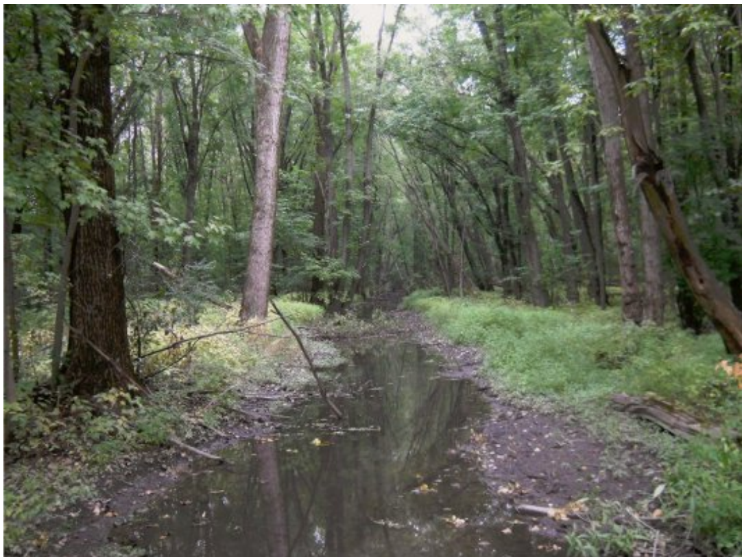
ph 7 : Ruisseau Vivian