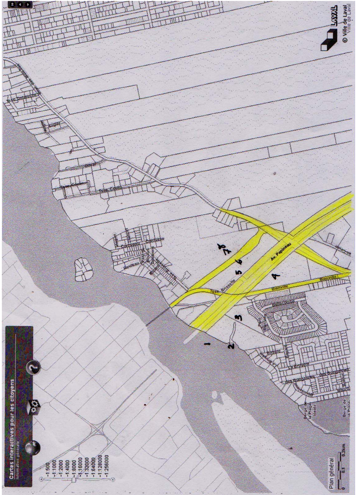
Secteur pont David