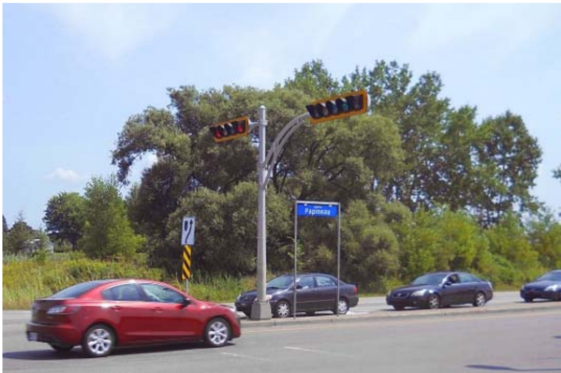
ph 10 : Saule, coin Papineau-des Perron (bassin de rétention naturel)