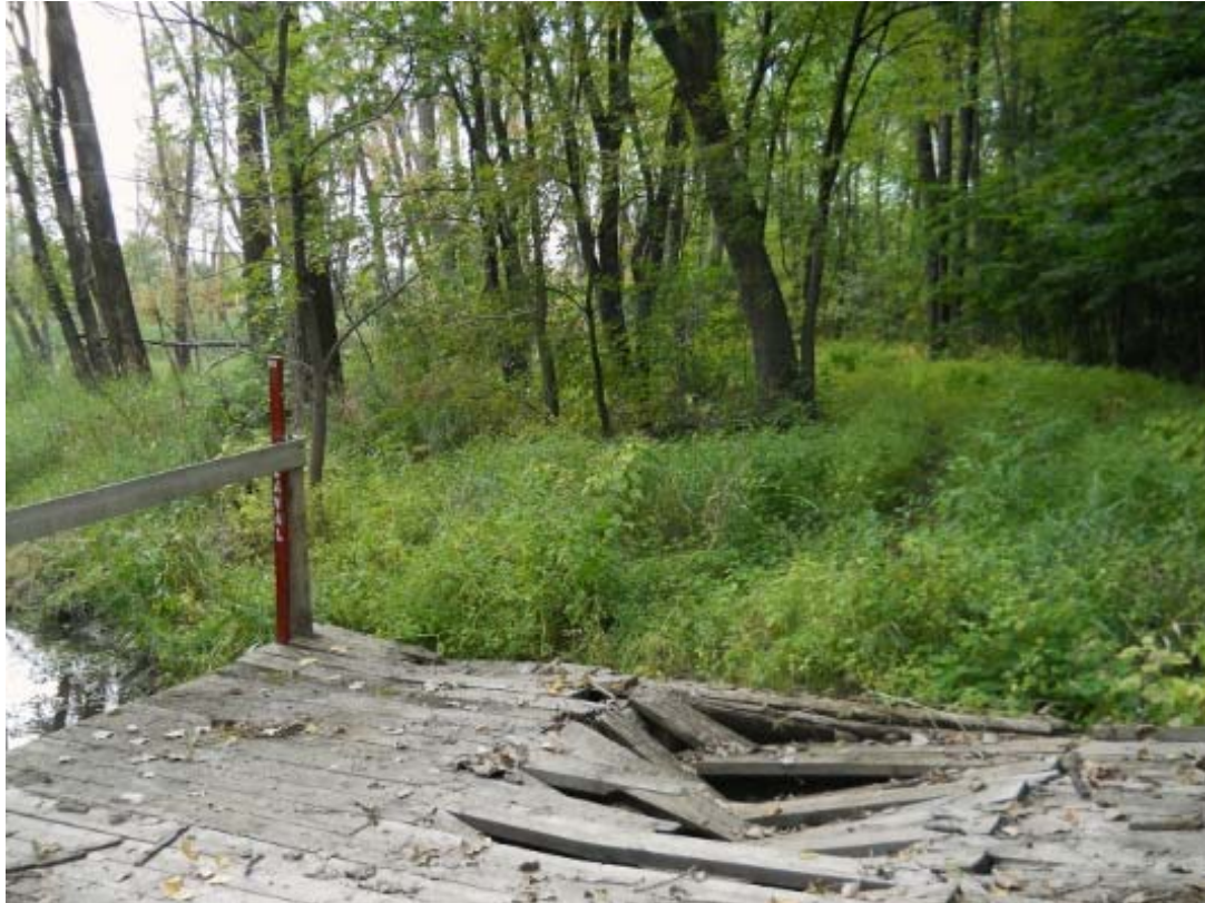
ph 6 : Pont sur le sentier de motoneige