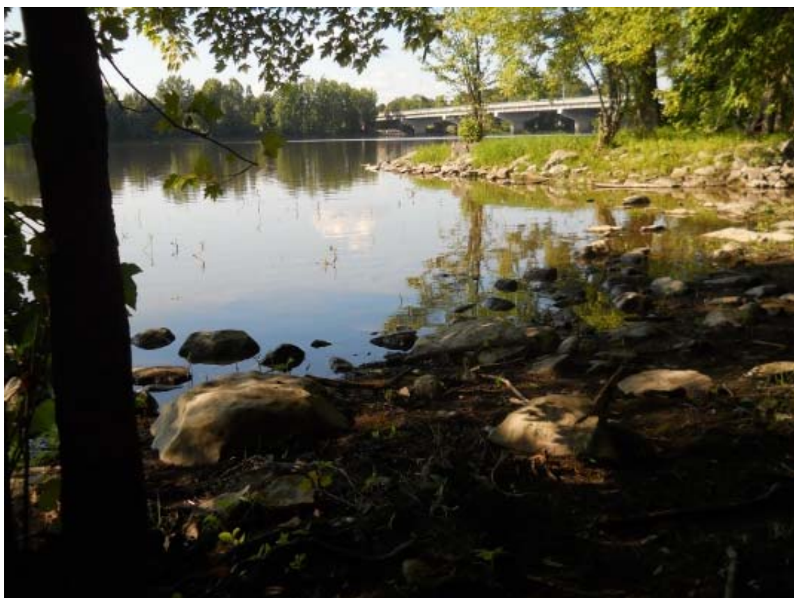
ph 2 :Rivière des Mille-Iles