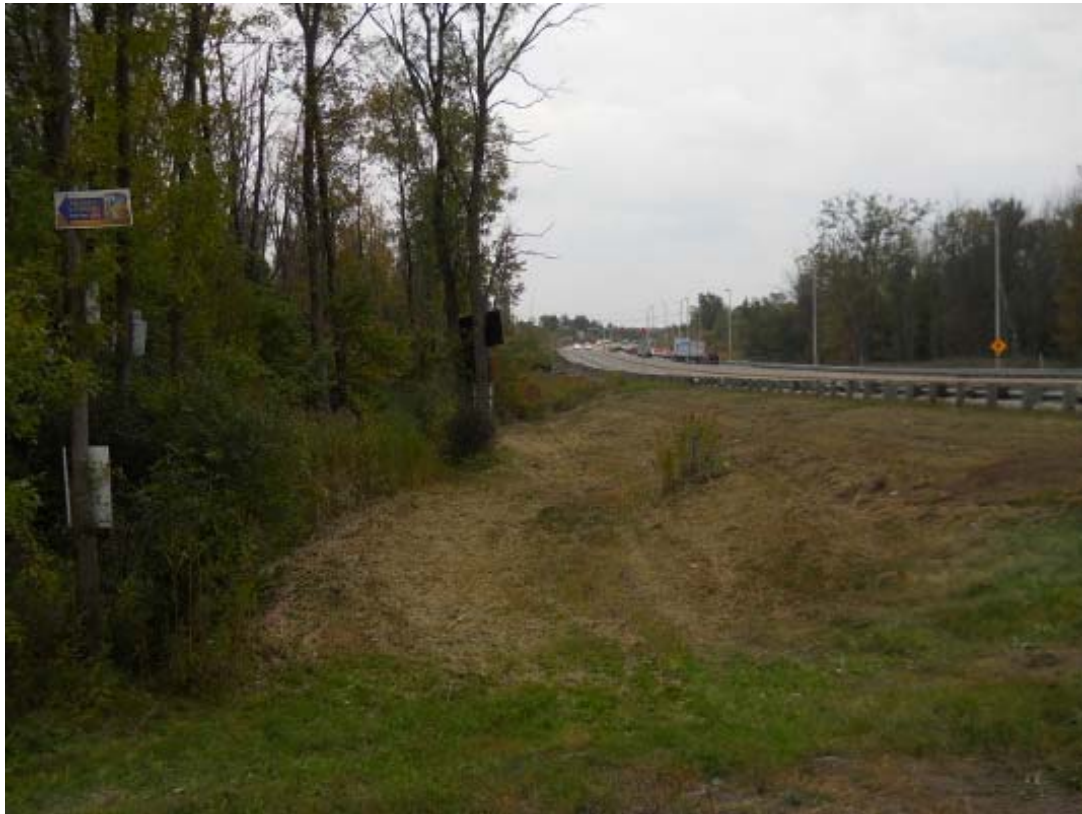
ph 5 :Route 335, direction sud, à la hauteur de l'usine d'épuration