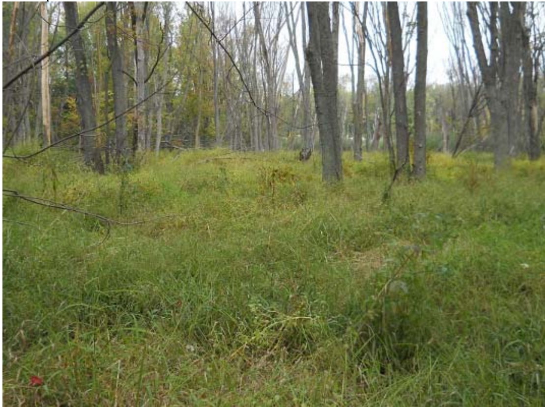
ph 4 : Marécage au coin nord-ouest de la 335 et des Laurentides