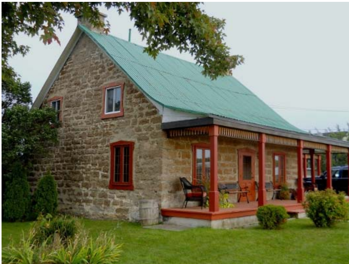
ph 13 : 2385 des Lacasse