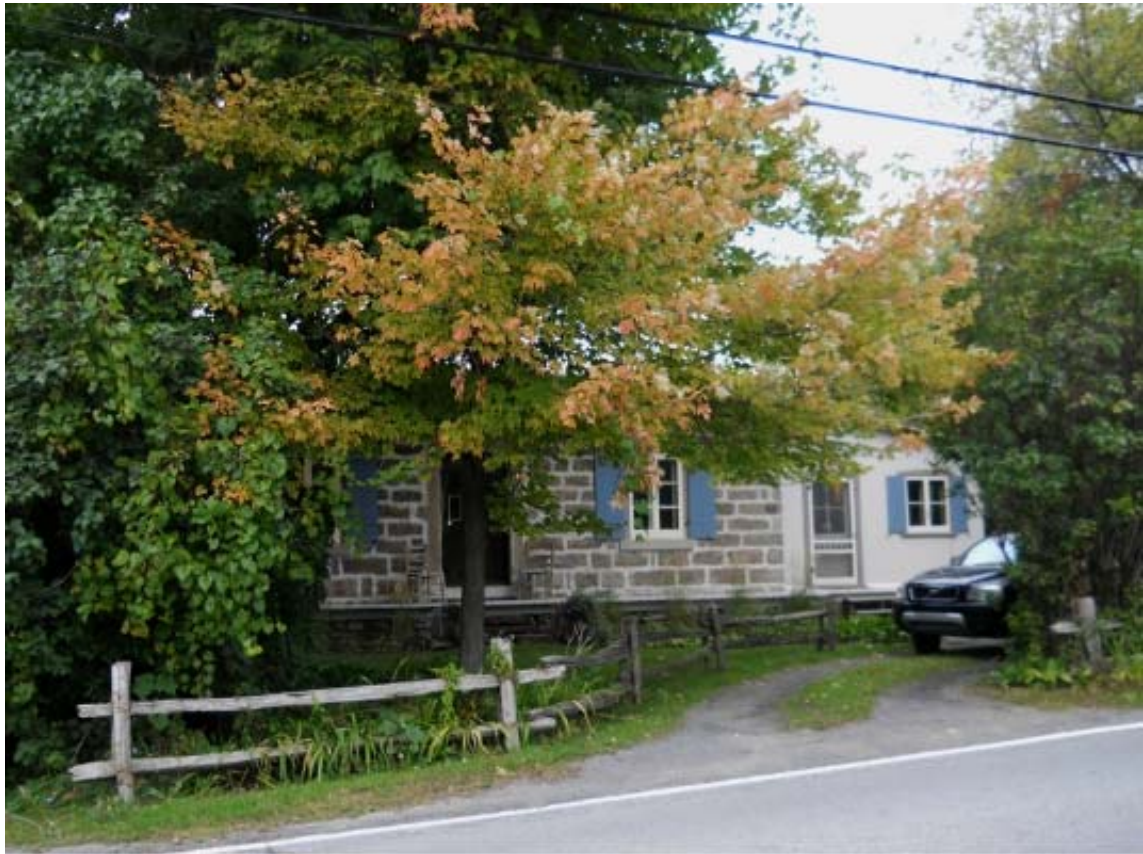
ph 9 : 1895 des Perron