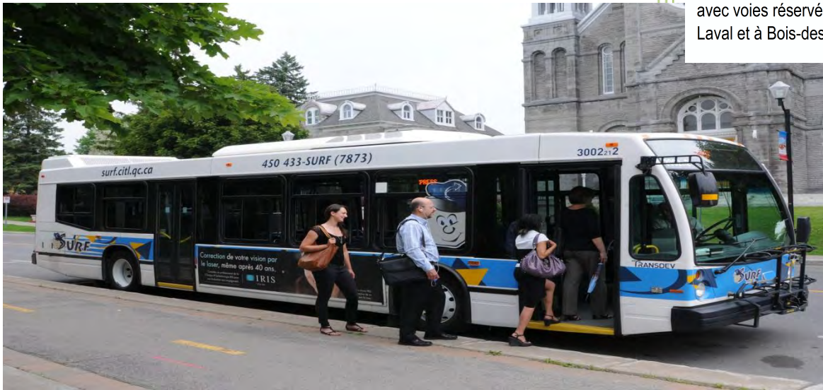
Table de concertation sur la mobilité urbaine de Sainte-Thérèse