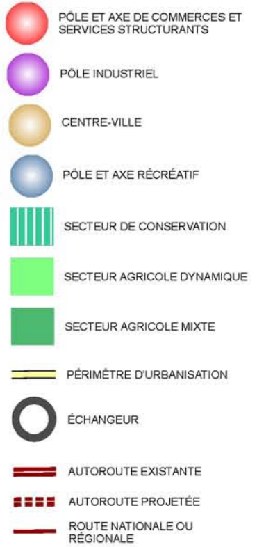
SCHÉMA D'AMÉNAGEMENT RÉVISÉ