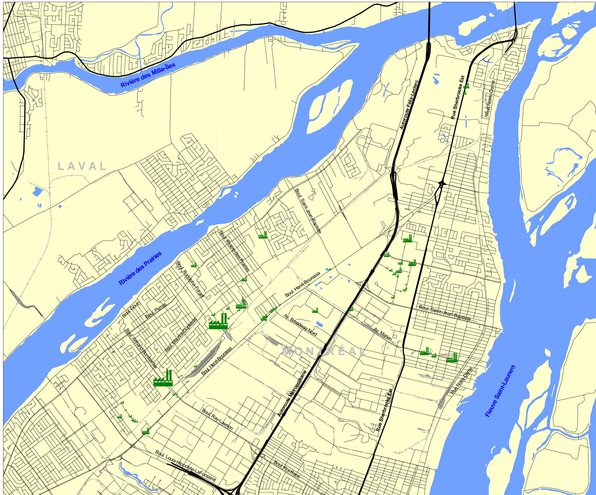
FIGURE 3 ÉTABLISSEMENTS SELON LE NOMBRE D'EMPLOYÉS PAR QUARTS DE TRAVAIL DE SOIR, ÉTÉ 2001