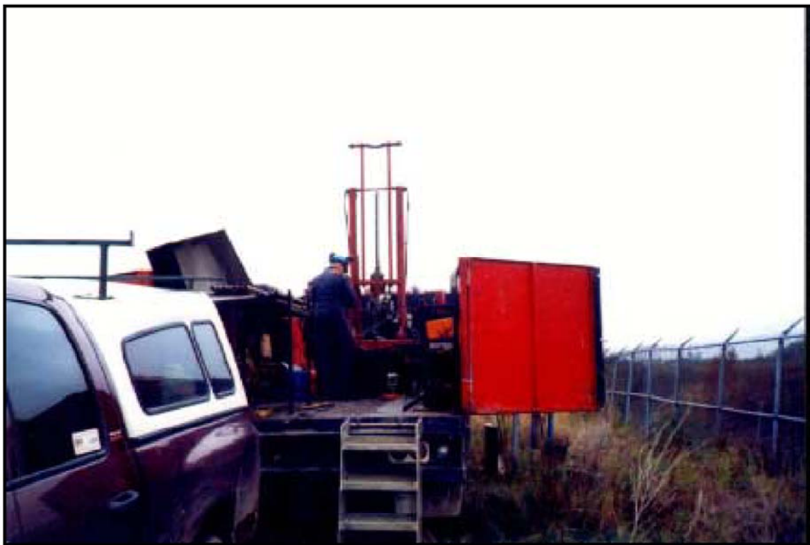
Photo no 2: Sondage au piézocône CPTU-1 à l'aide du bâti de poussé hydraulique (2002/10/16).