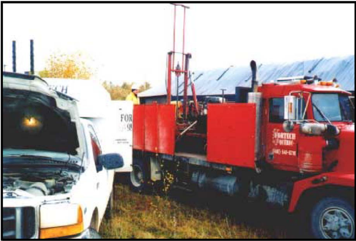
Photo no 1: au piézocône CPTU-8 à l'aide du bâti de poussé hydraulique (2002/10/16).