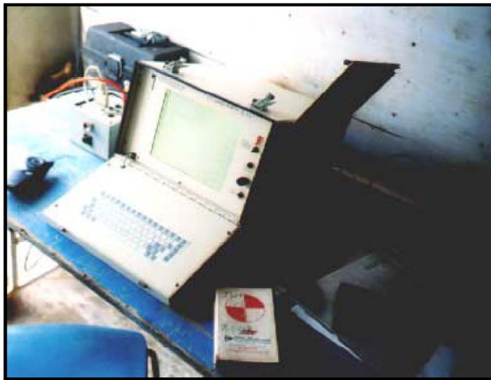
Photo no 4: Système d'acquisition de données hogentogler (2002/11/11).