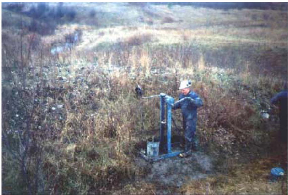
Photo no 5: Sondage au piézocône CPTU-19 à l'aide du bâti de poussé manuel (2002/11/11).