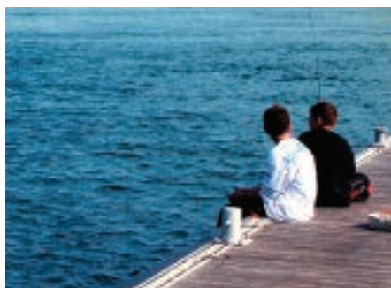
ILLUSTRATION 2.7.1 LA QUALITÉ DE L'EAU EN RIVE – 2003