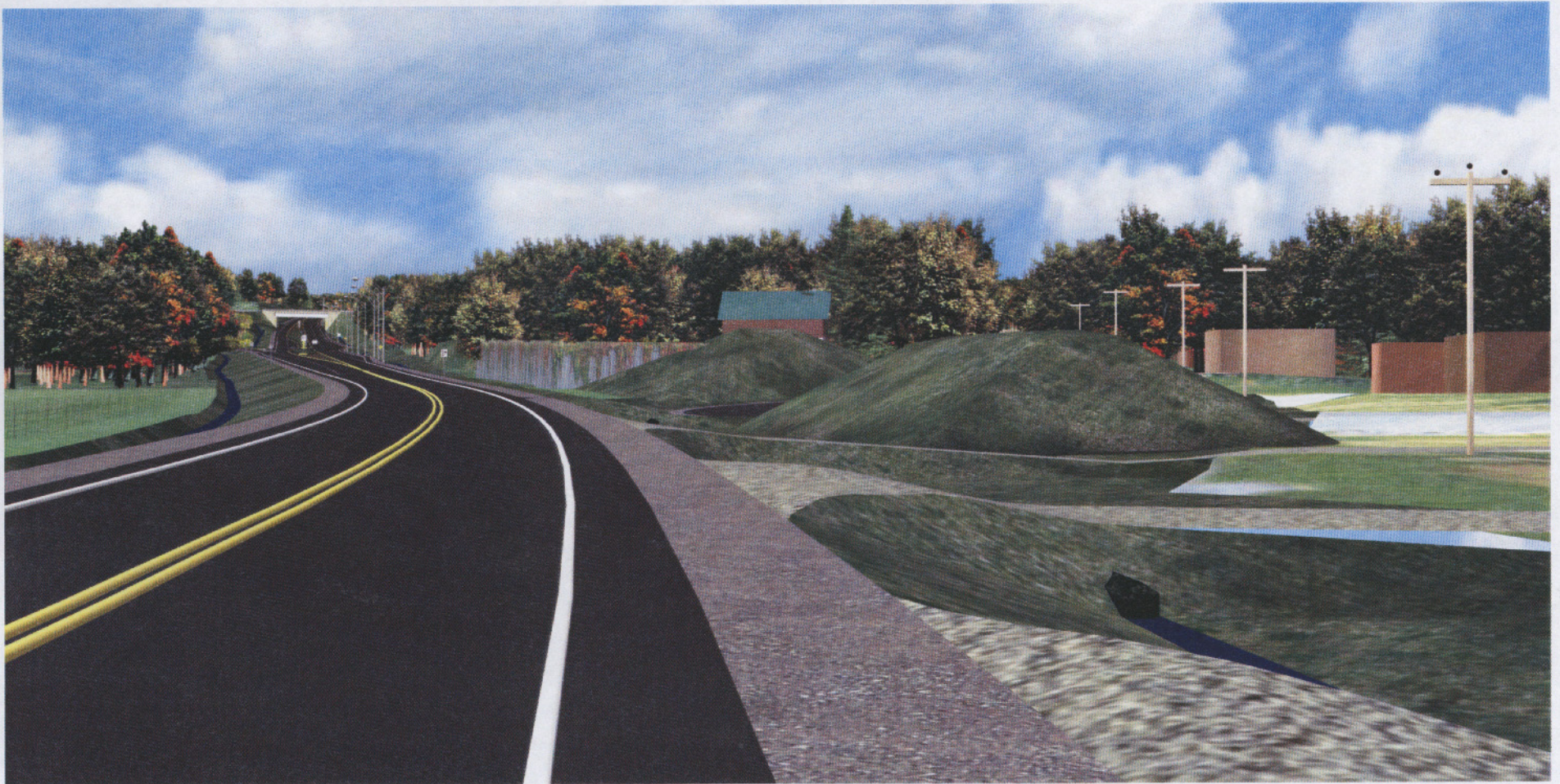
Vue à partir de la nouvelle route 367

1293, route de Fossambault M. et Mme Richard