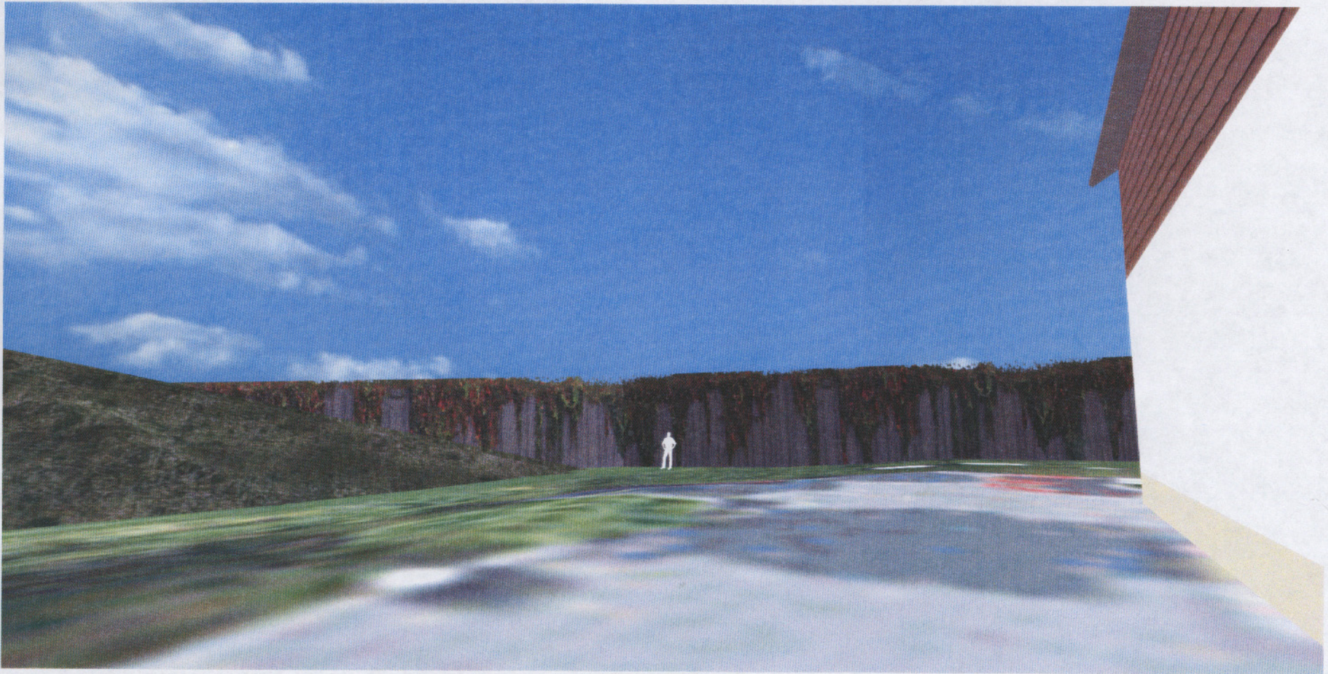
Vue à partir du stationnement sans arbres