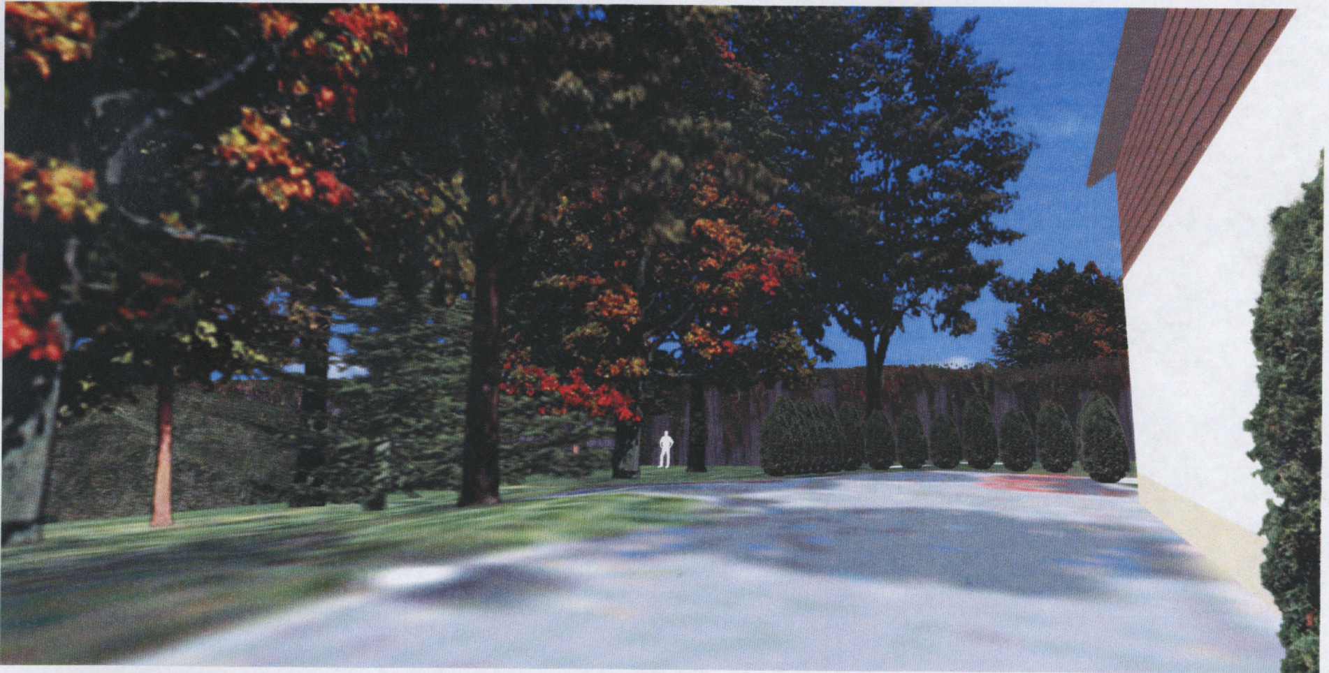
Vue à partir du stationnement avec arbres