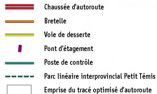
Figure 6.15 : Tracé optimisé d'autoroute de Notre-Dame-du-Lac à Cabano (Tronçon 3)

Échelle 1:20 000 400 m 200 0 0,1 0,2 0,3 0,4 km