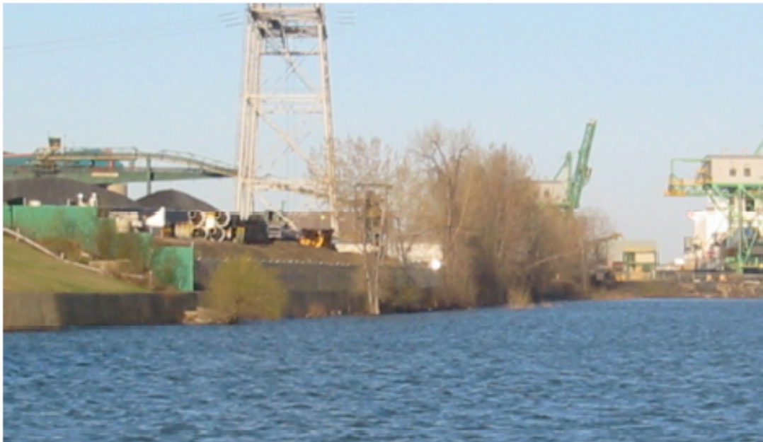
Photo 2: Vue diagonale de la rive où se trouve l'herbier encore submergé le 27 avril 2006.