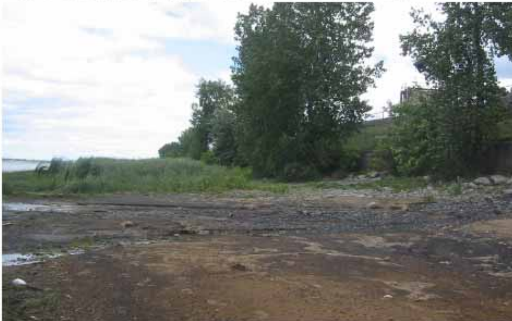
Photo 10: Vue vers l'est de la végétation derrière l'herbier aquatique émergé le 23 août 2006