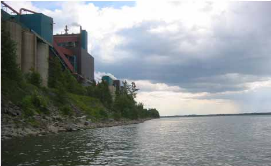
Photo 12: Vue de la rive du côté ouest du quai actuel, le 15 juin 2006