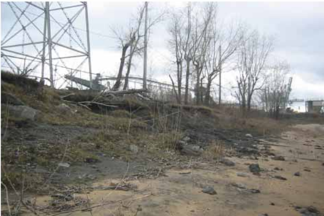
Photo 6: Vue vers l'ouest du haut de la plage dans la zone du remblai projeté le 13 avril 2006.