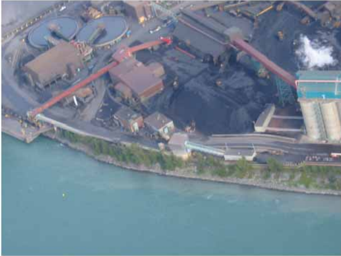
Photo 13: Vue aérienne de la rive du côté ouest du quai actuel, le 23 août 2006