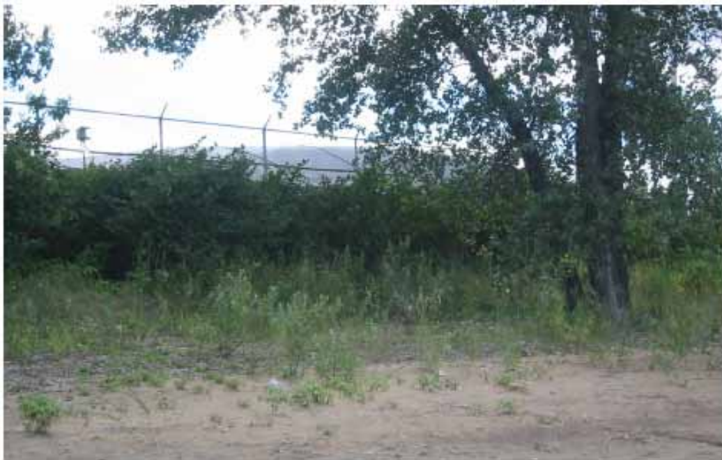
Photo 8: Vue de la bande de végétation hors de la zone de remblai le 23 août 2006