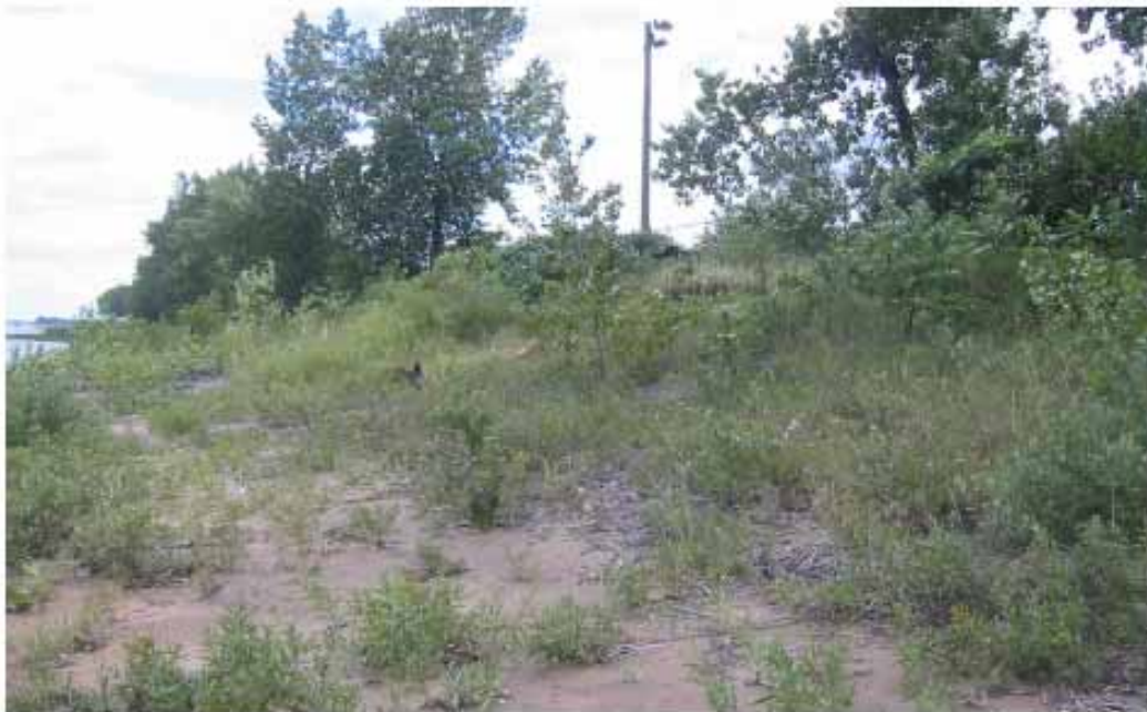
Photo 7: Vue vers l'est du haut de la plage le 23 août 2006 dans la zone du remblai projeté.