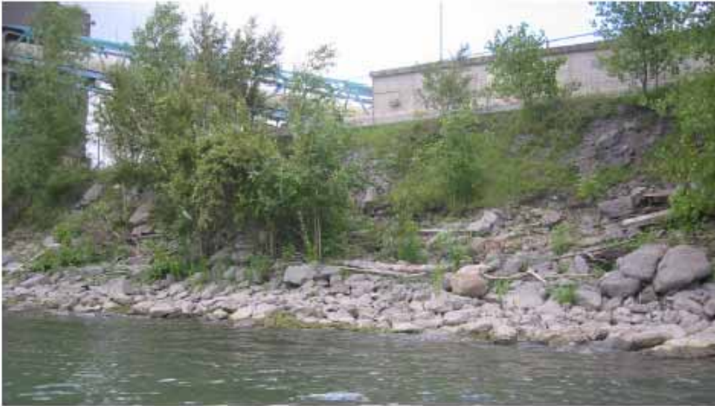
Photo 11: Vue de la rive du côté ouest, près du quai actuel, le 15 juin 2006