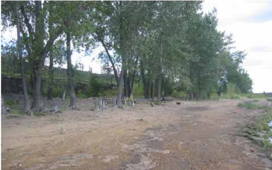
Photo 9: Vue de la bande de végétation hors de la zone de remblai le 23 août 2006