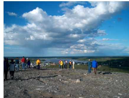
Visite «Porcupine Comité de Vigilance»