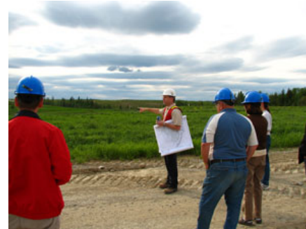
Visite Partenariat PGM