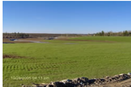
Haldes à résidus Coniaurum après l'application de produit dérivé de pulpe de bois