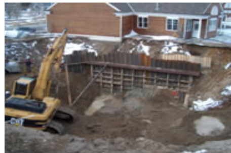
Terrain de Golf Hollinger (Pro Shop) Réhabilitation d'une zone d'effondrement