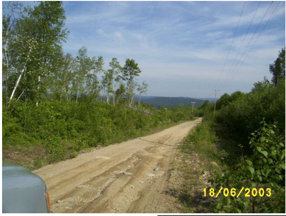
Photo n° 11 Vue sur une route forestière donnant accès au barrage.