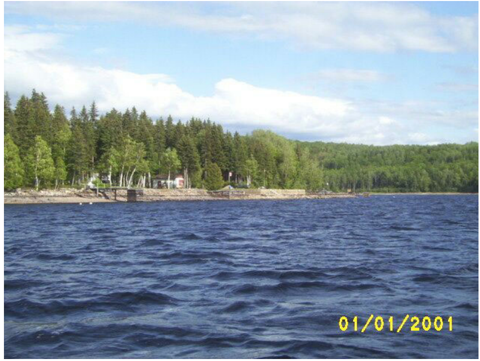
Photo n°9 Vue sur les chalets en bordure de la Baie des Quenouilles.