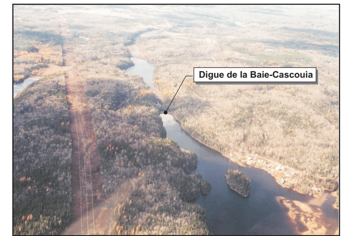
Digue de la Baie-Cascoïa