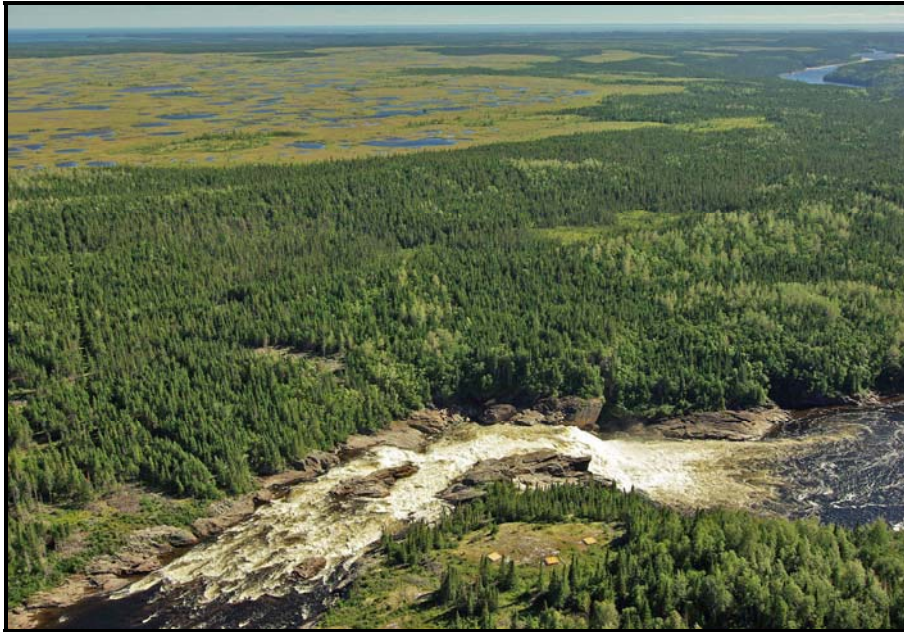
Photo 7 : La Grande Chute au pied de laquelle les Innus pêchent le saumon

Les principales rivières à saumon du territoire traditionnel de pêche des Innus d'Ekuanitshit, notamment la rivière Saint-Jean [ Patamiu-hipu ], la rivière Mingan et son tributaire la rivière Manitou, ainsi que la rivière Romaine, ont ainsi été louées à des étrangers qui y pratiquaient la pêche sportive. Les locataires engageaient des gardiens afin de faire respecter la réglementation. Littéralement exclus, les Innus d'Ekuanitshit, tout comme les autres groupes Innus de la Côte-Nord, ont poursuivi leur fréquentation des rivières pour la pêche au saumon, de manière plus ou moins « clandestine ». De nombreux conflits impliquant les autochtones ont par ailleurs eu lieu sur les rivières à saumon dès la mise en application de la réglementation, au XIX e siècle. Cette situation perdura pendant plus d'un siècle pour aboutir à la « guerre du saumon » au début des années 1980. Sur pratiquement l'ensemble de la Côte-Nord, les autochtones protestaient alors fortement contre l'appropriation des rivières à saumon par des étrangers et leur propre exclusion de ces dernières. 22