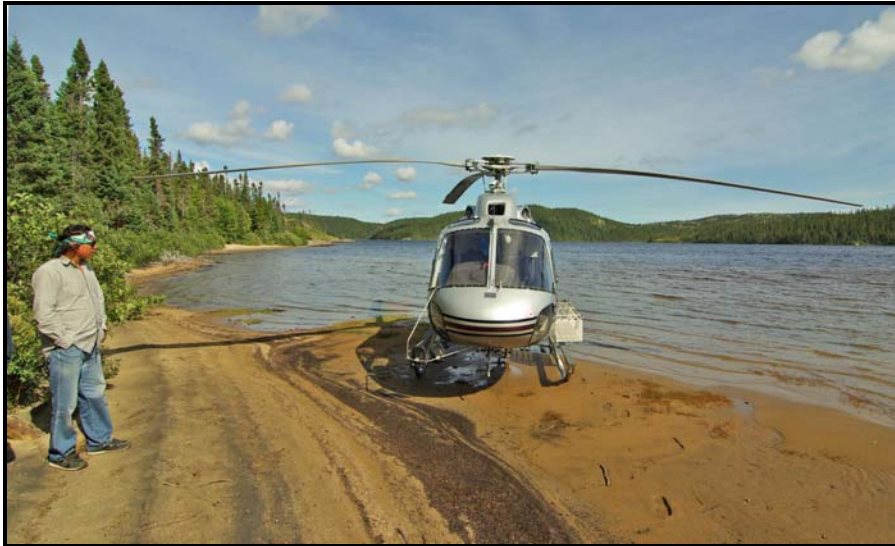
Photo 1 : Un chasseur d'Ekuanitshit pendant la validation des données

Les entrevues semi-dirigées avec les utilisateurs ont été réalisées à leur domicile, alors que celles auprès des gestionnaires se sont déroulées au conseil de bande. La durée des entrevues semi-dirigées a généralement varié entre 1,5 et 4 heures. La plupart des entrevues se sont déroulées en langue innue avec l'aide d'un interprète. Les entrevues ont été enregistrées en format numérique, sauf dans quelques cas, où les informateurs ont préféré que les informations soient notées. Les données cartographiques ont été reportées sur des cartes à la précision de 1 : 50 000 pour l'intérieur des terres et de 1 : 20 000 pour la côte.