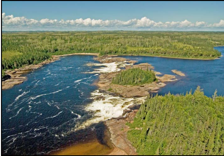
Photo 9 : La plus importante aire de pêche au saumon comprend la Chute à Charlie [ Hikaikapish ]

L'omble de fontaine est également exploité par les pêcheurs innus. Ces derniers concentrent leurs activités dans une zone s'étendant de l'Île des Officiers [ Kaminikapio Ministuk ] jusqu'à la Chute à Charlie. Un succès de pêche intéressant a été rapporté par les pêcheurs. Les informateurs ont par ailleurs mentionné ne pas exploiter l'omble de fontaine anadrome dans la rivière Romaine.