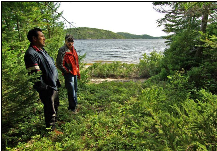
Photo 4 : Un des trois emplacements pour tente du campement 219, ouvert au sud

Depuis que le Conseil de bande d'Ekuanitshit exploite la pourvoirie du lac Allard dont les chalets sont situés l'un au sud-ouest du lac (campement 272), l'autre, acquis récemment, au nord-ouest (campement 273), plusieurs Innus vont séjournier dans cette