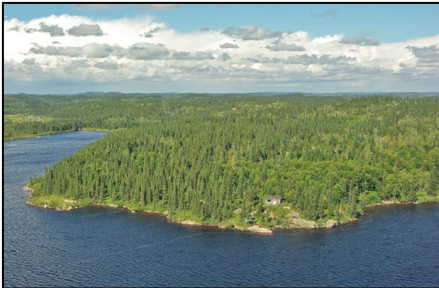
Photo 2 : Le chalet du conseil de bande sur un des lacs Kaumutshishtukuanu

Il y a quelques années, le conseil de bande a fait l'acquisition d'un chalet sur la rive du lac à Flo (un des lacs Kaumutshistukuanu) (campement 8). Le chalet a fait l'objet d'améliorations en août 2006 pour mieux accueillir les membres de la communauté, qui le fréquentent dorénavant en toute saison. L'exploitation de quelques lacs situés à l'intérieur du corridor en est maintenant facilitée. En plus du piégeage du castor et de la loutre, les activités les plus pratiquées dans ce secteur sont le piégeage de la martre, la pêche à l'omble de fontaine et la chasse au petit gibier. Les campements 136, 137, 138 et 155, situés dans le corridor ou à proximité, peuvent encore être fréquentés, par exemple, si le chalet est déjà occupé.