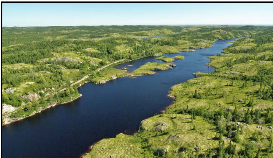
Photo 5 : Le lac Uffin, où des Innus débarquent parfois pour chasser

Aux mois d'octobre-novembre 2006, deux innus ont piégé le castor au lac Uffin et le long du chemin de fer pendant deux semaines. Ils ont installé un premier campement sous la tente pendant une semaine au lac même (campement 152) et un deuxième campement en tente pendant une autre semaine près de la roulotte des travailleurs de la mine (campement 153). Un campement inactif (132), utilisé il y a plus de dix ans pour le piégeage du castor, est aussi situé dans le corridor.