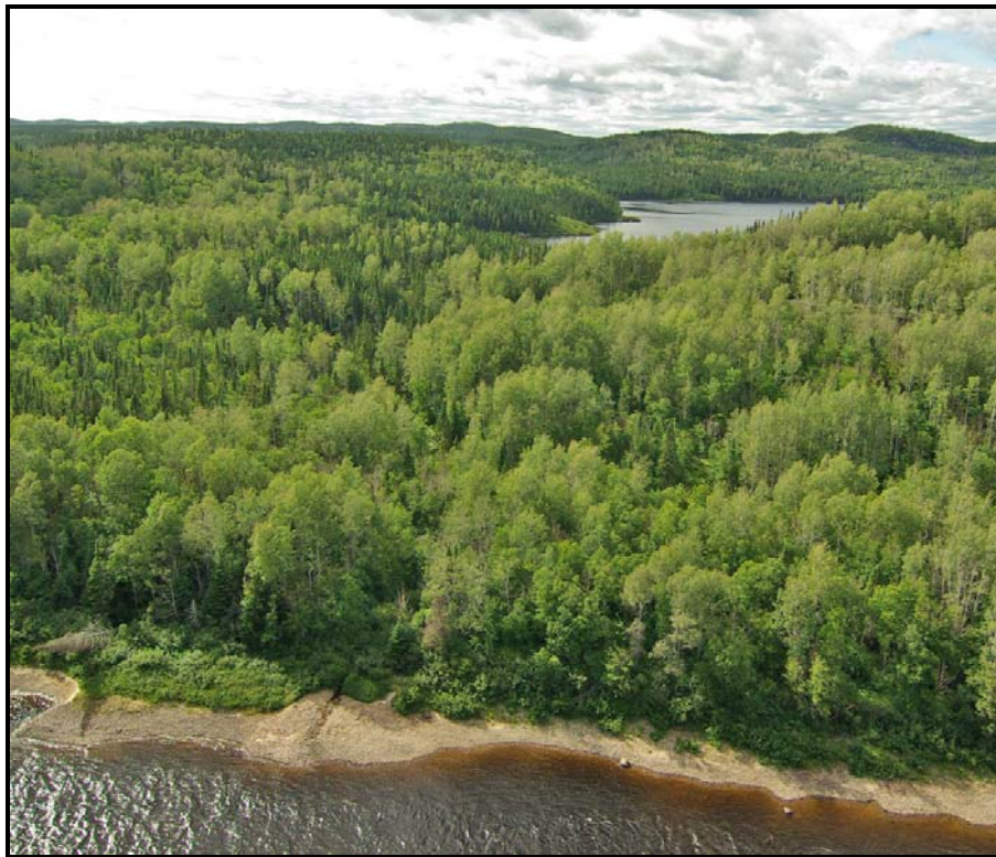
Photo 6 : L'entrée de Papian Utshetetan , le « portage à Fabien » au PK 71

Un ancien portage entre la pointe nord-ouest du lac Puyjalon et la rivière Romaine au PK 92, qui était utilisé notamment pour rejoindre le secteur du lac Sanson (au nord-est du PK 120) lorsque les Innus rejoignaient en canot leurs territoires de chasse, est susceptible d'être utilisé de nouveau en canot avec les aménagements routiers projetés. La portion de ce portage qui ne serait pas envoyée pourrait servir à rejoindre le lac Puyjalon à partir de la route d'accès aux centrales. Ce portage est entièrement situé à l'intérieur du corridor sud.