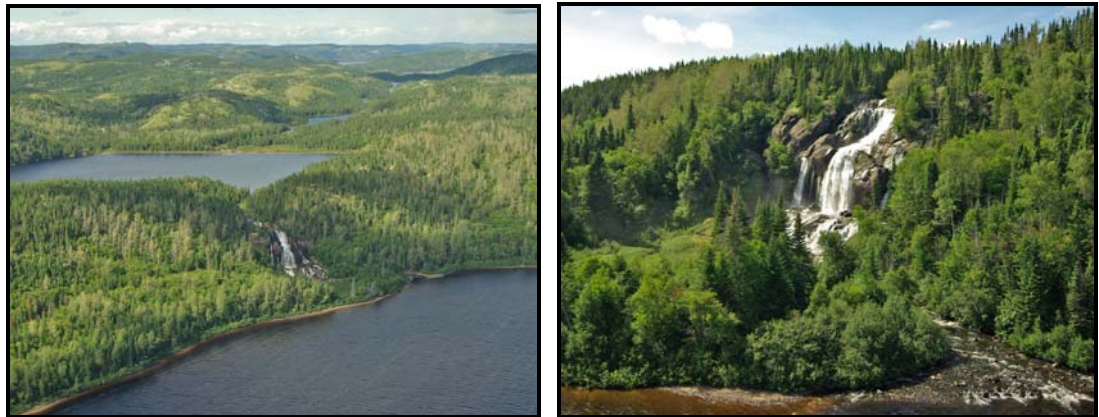
Photo 3 : La chute à proximité du campement 60 sur le lac Puyjalon

Certains utilisateurs fréquentent aussi d'autres campements établis sur le lac Puyjalon (campement 146) et sur les petits lacs du chemin de portages entre la voie ferrée et le lac (campements 61 et 144). D'autres campements utilisés jusque dans les années 1980 ou 1990 par différents groupes familiaux d'Ekuanitshit dans les environs du lac Puyjalon se trouvent à l'intérieur du corridor (campements 60, 62, 64, 66, 67, 68, 133, 135 17 , 221 et 222). Il en est de même du portage à l'extrémité sud du lac, qui peut être