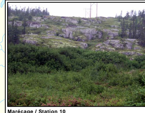
Marécage / Station 10