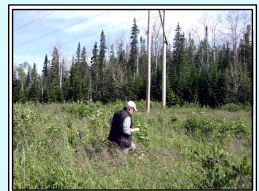
Feuillus (défoliés) / Station 6