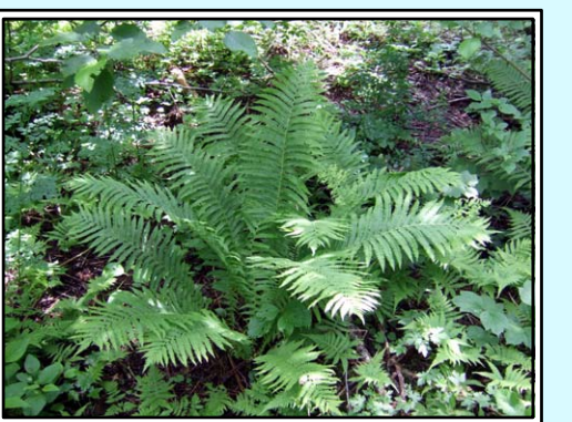
Matteucie fougère-à-l'autruche / Station 13