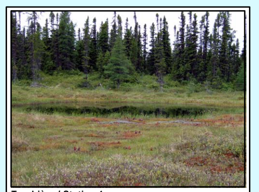
Tourbière / Station 1