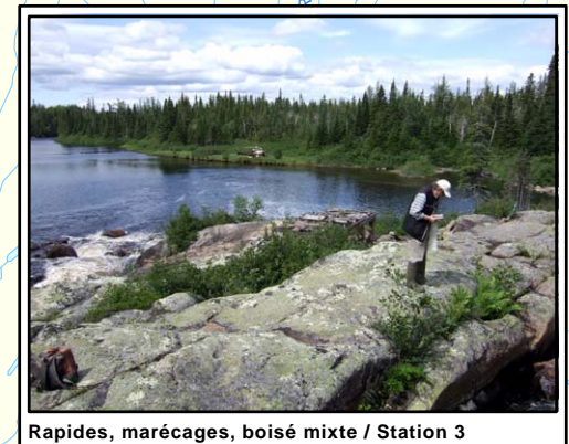
Rapides, marécages, boisé mixte / Station 3