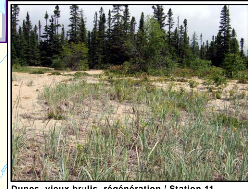
Dunes, vieux brulis, régénération / Station 11