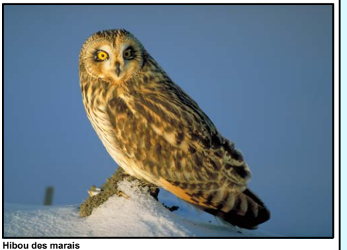
Hibou des marais