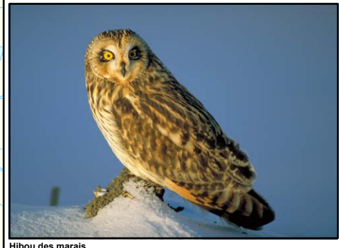
Hibou des marais