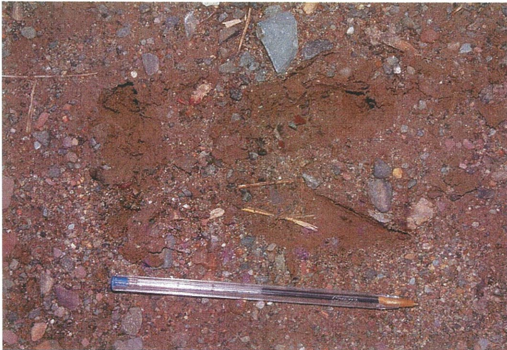
Photo 2. Trace de cerf de Virginie