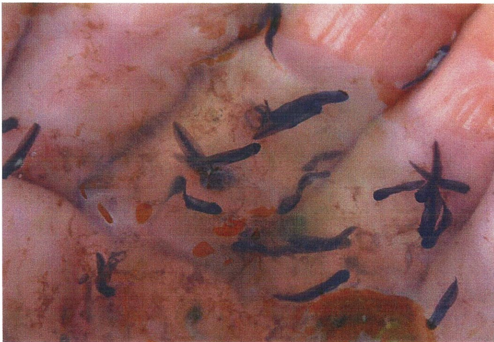
Photo 4. Têtard de la reinette crucifère