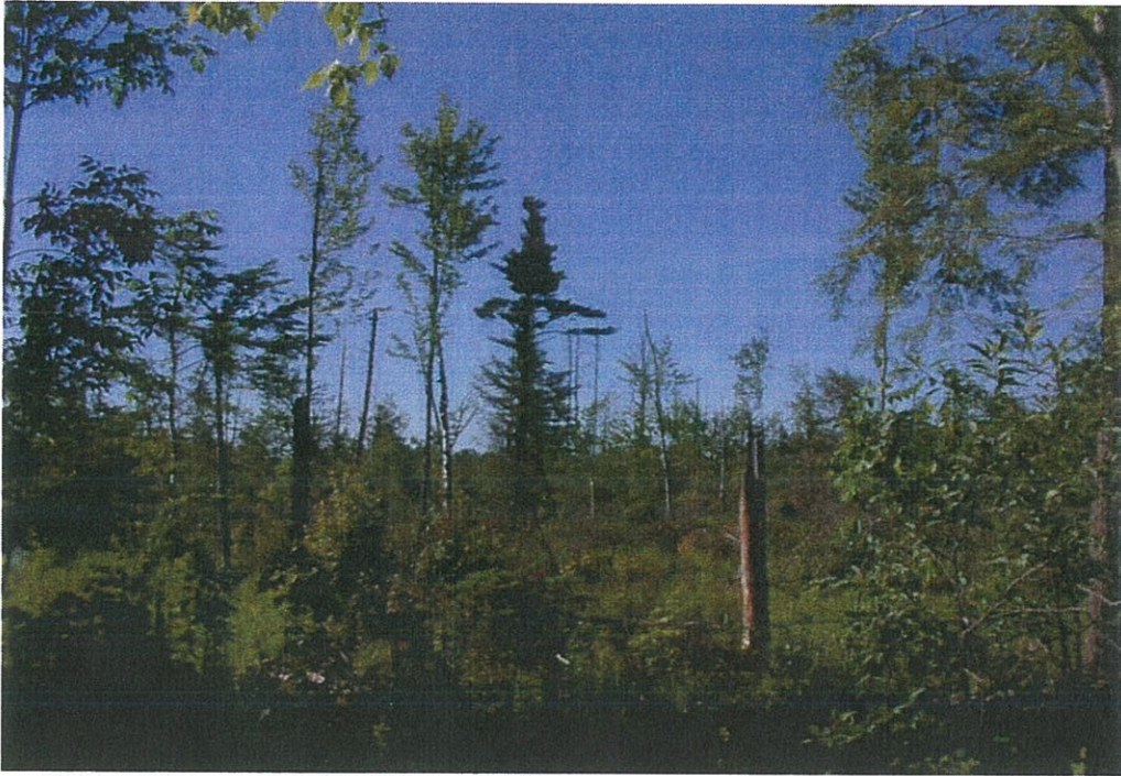
Photo 9. Friche avec quelques chicots