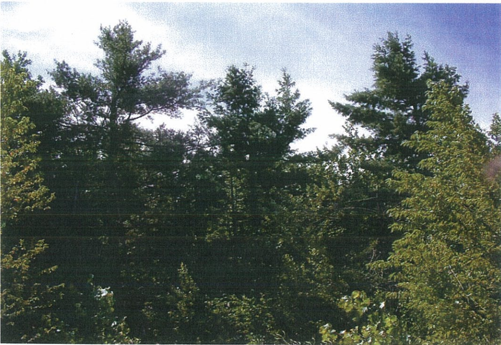
Photo 10. Lisière de pin blanc