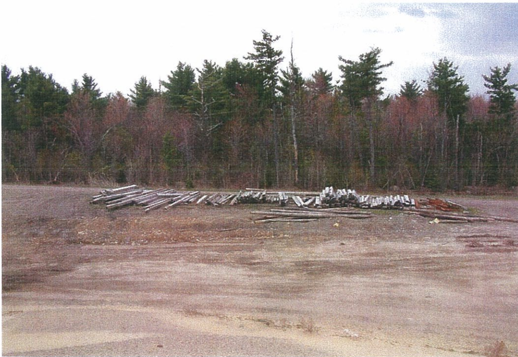
Photo 6. Aire (LES existant) adjacente à la zone d'étude immédiate