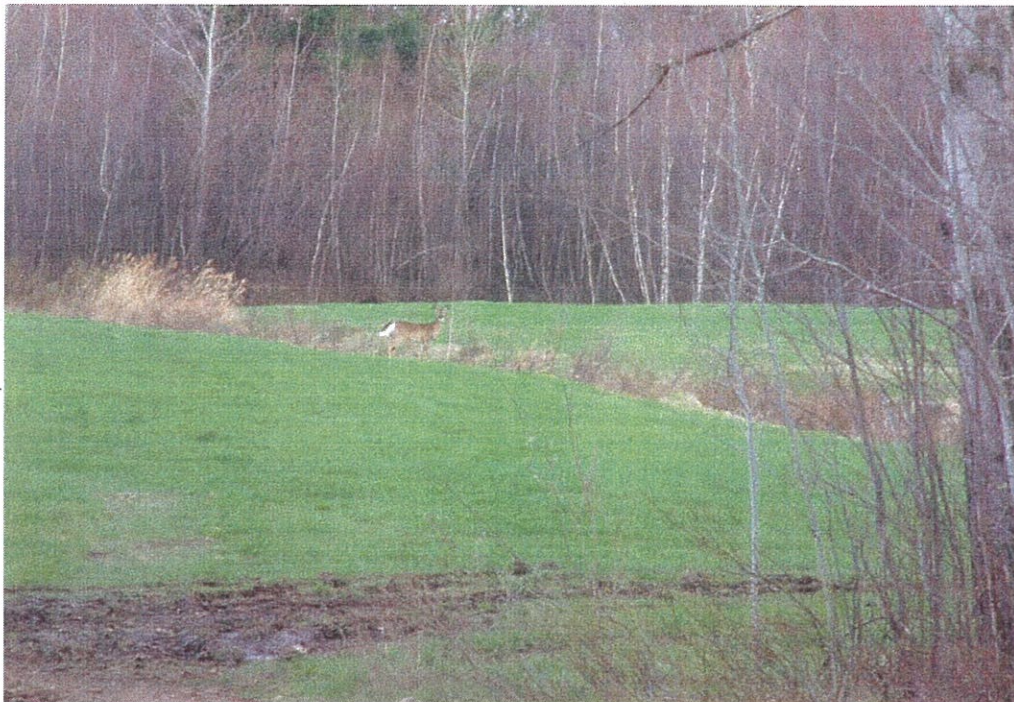
Photo 3. Cerf de Virginie dans le champ agricole au centre de la zone d'étude immédiate