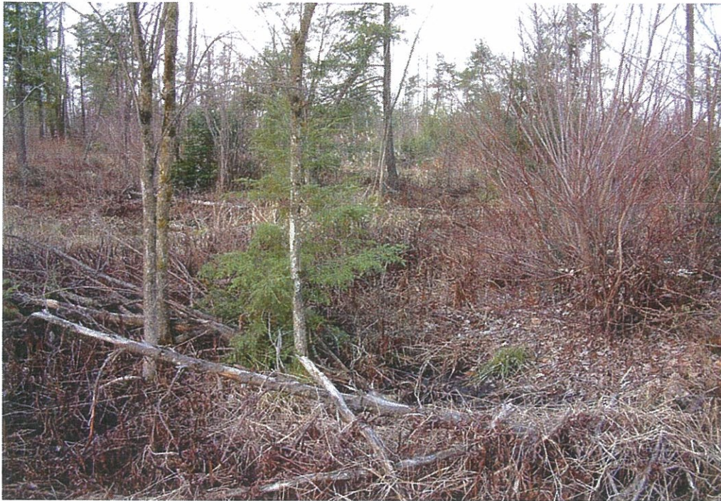
Photo 5. Aire avec drainage déficient