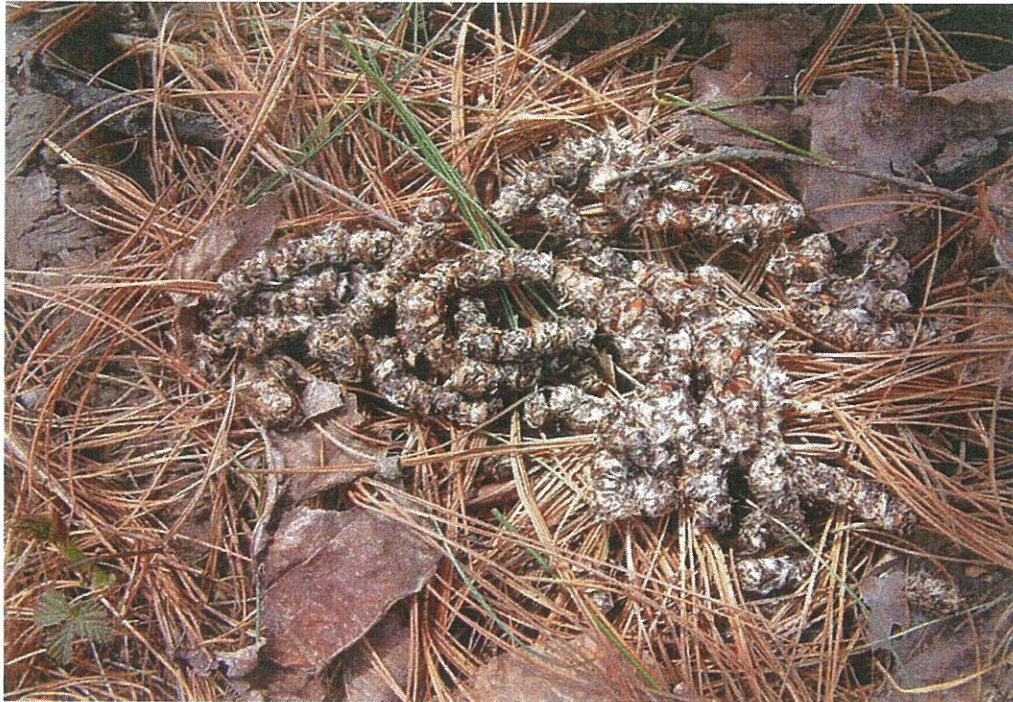
Photo 1. Crottin de gélinotte huppée