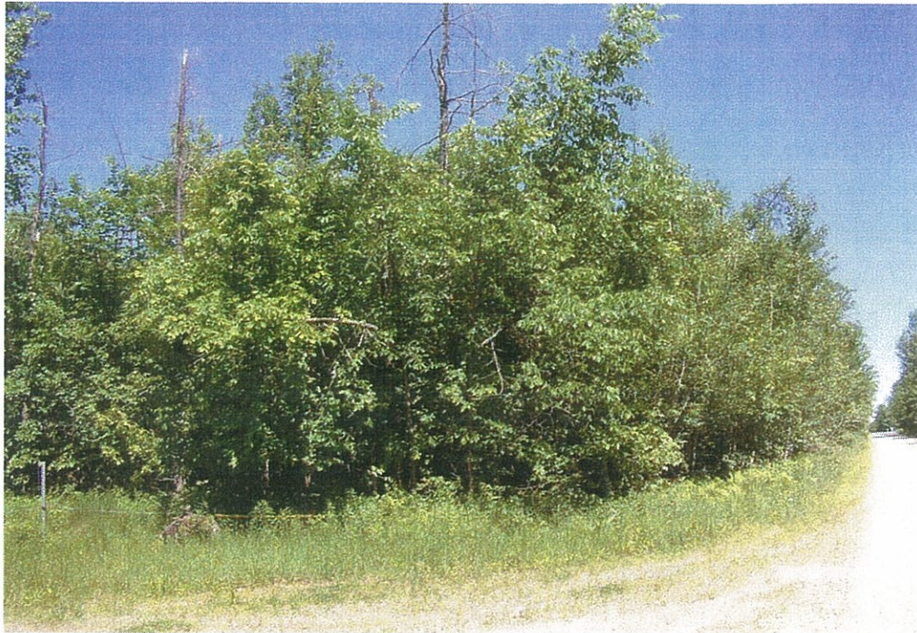
Photo 7. Érablière à érable rouge