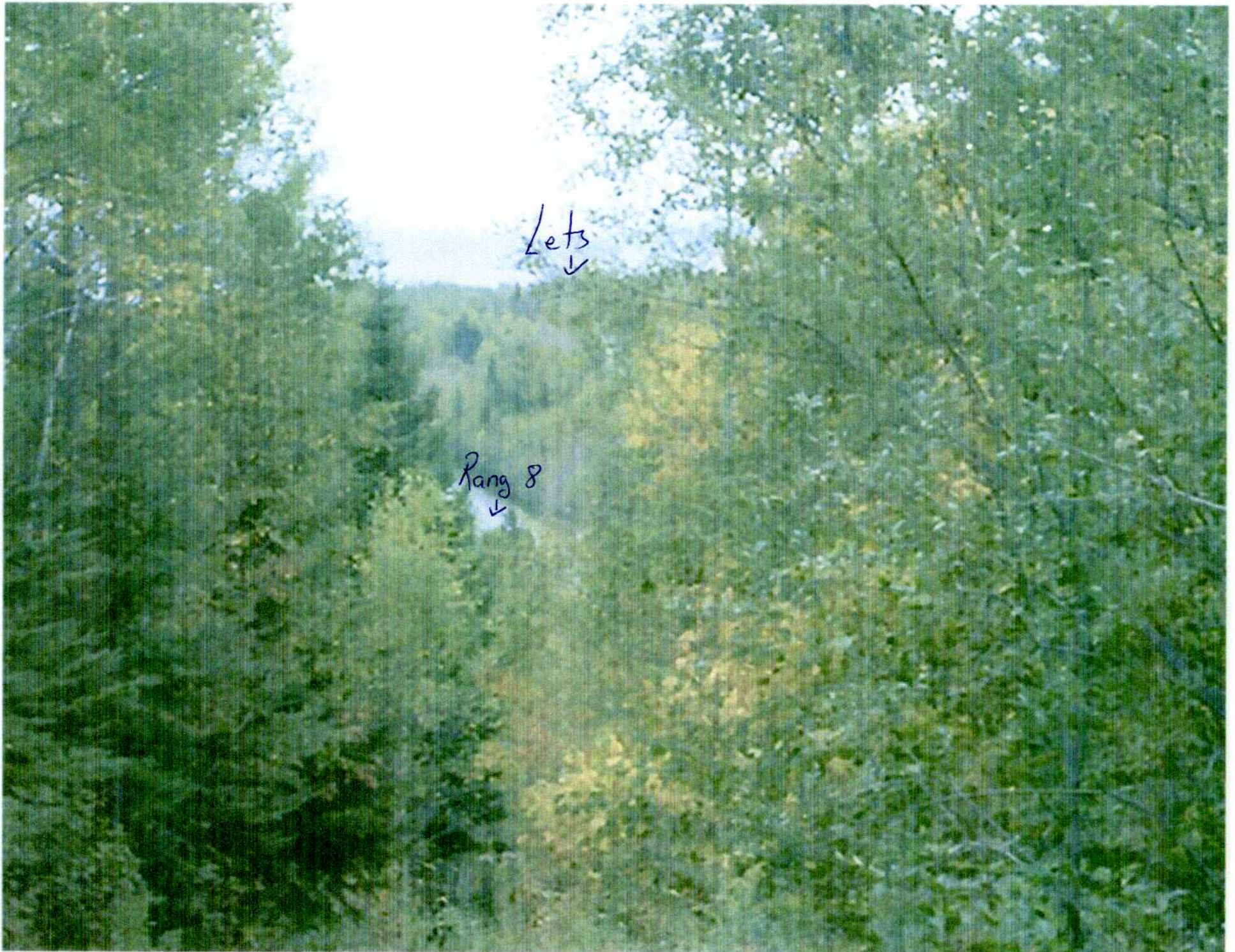
vue a partir de notre chemin