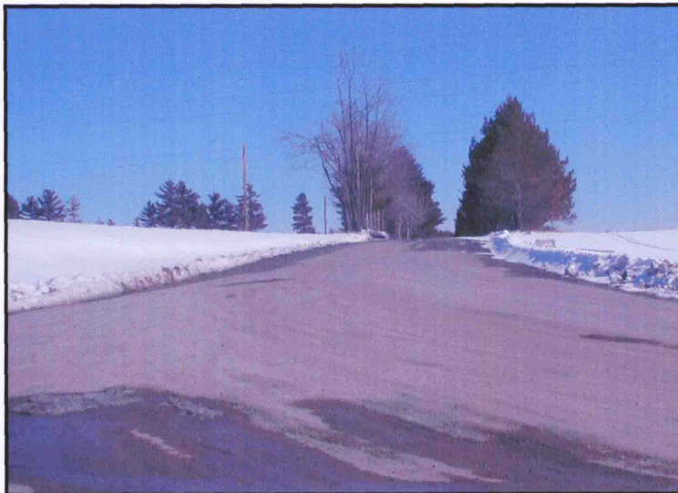
Vue en 2002