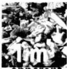
apparent de plaquettes