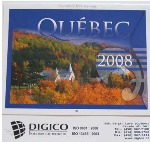
Fig. 1 Calendrier 2008