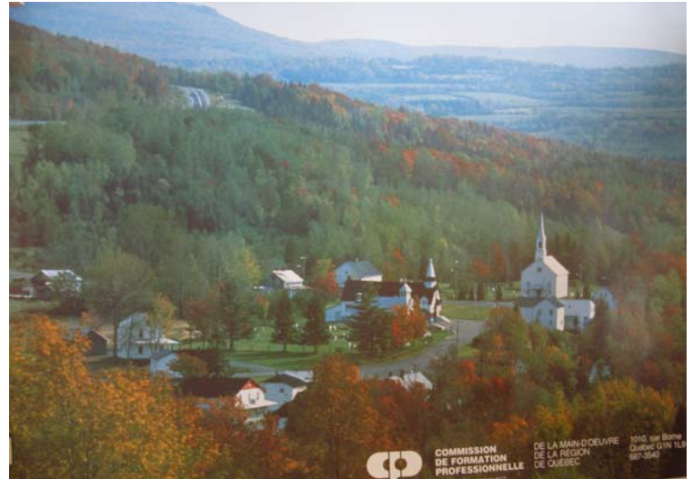
Fig. 2 Affiche promotionnelle de la Commission de formation professionnelle de la main-d'œuvre de la Région de Québec