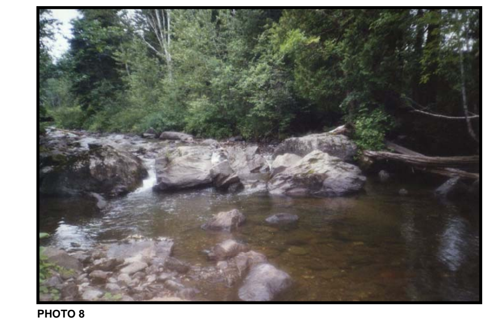
PHOTO 8 Rivière Bleue