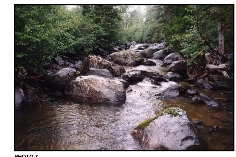
PHOTO 7 Rivière Bleue