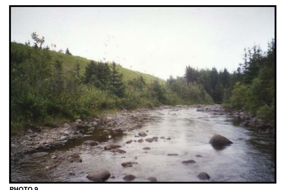
PHOTO 9 Rivière Bleue