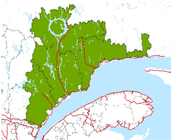
Figure 1. Unités d'aménagement forestier de la région administrative de la Côte-Nord