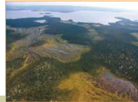
Tourbières en bordure du lac Ménistouc (D. Boisjoly MDDEP)