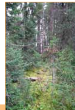
Pessière à sapin beaumier