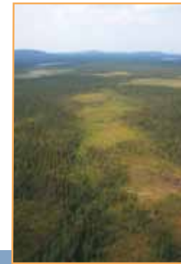
Pessière à mousse