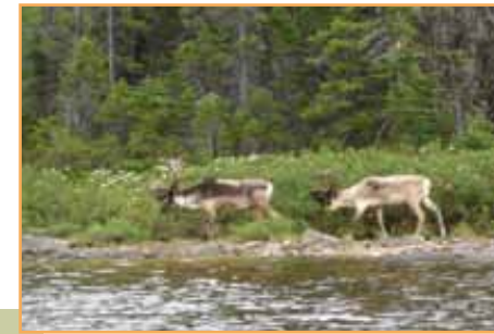
Caribou forestier (D. Hewitt)