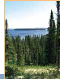
Pessière noire à lichen