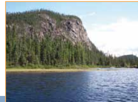
Affleurements rocheux