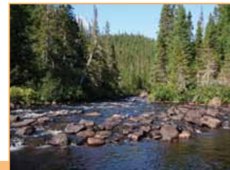
Rivière Godbout (D. Boisjoly MDDEP)