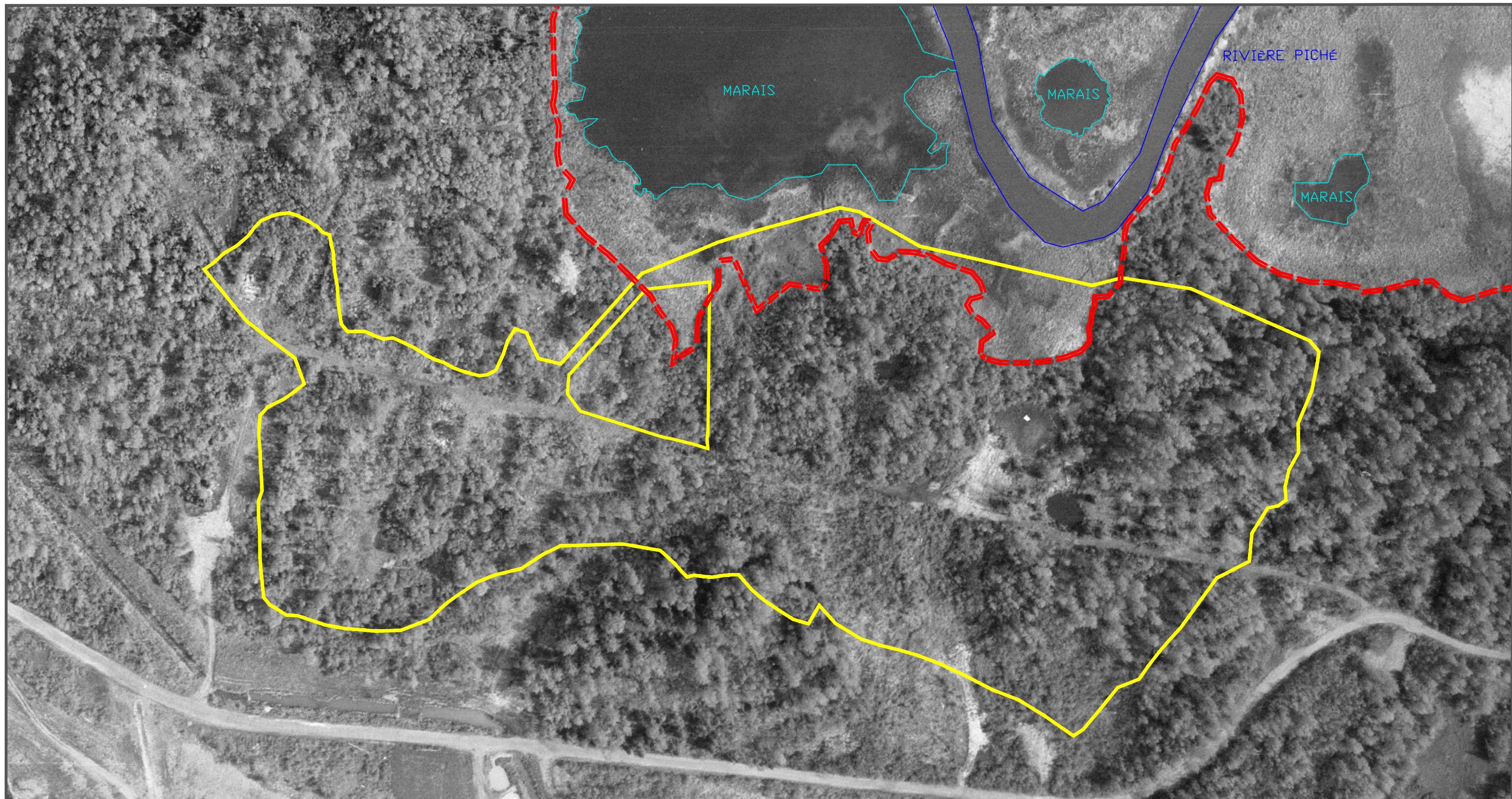
Photo aérienne du site en juin 2002