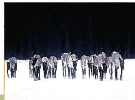
Caribou forestier (MRFN)