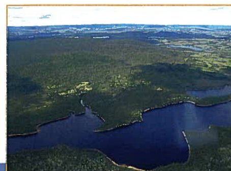
Massif de vieilles forêts près de la rivière Cocoumenen