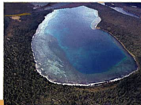
On retrouve un lac aux eaux turquoise dans la réserve (M.-A. Bouchard)