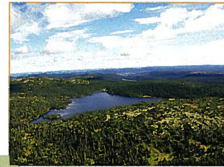
Toundra sur les sommets (M.-A. Bouchard, MDDEP)