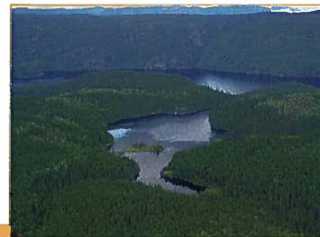
Petit lac au sommet de l'île située la plus à l'ouest, avec l'île principale en arrière-plan