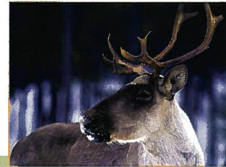
Caribou forestier (MRNF)