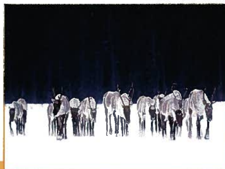
Caribou forestier (MARNP)