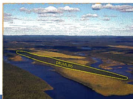
Drumlin entre deux tourbières (M.-A. Bouchard, MDDEP)