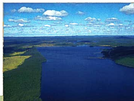
Lac Clérac