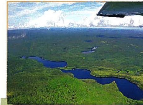
Le lac Panache et la rivière Croche