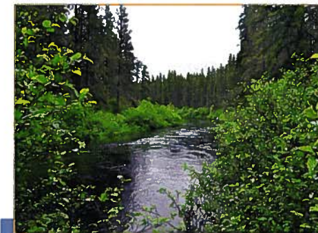
La rivière Croche (A. R. Bouchard, MDDEP)