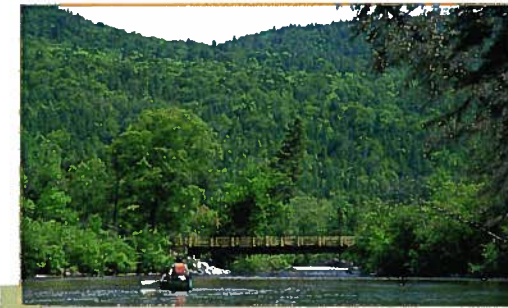
Descente en canot