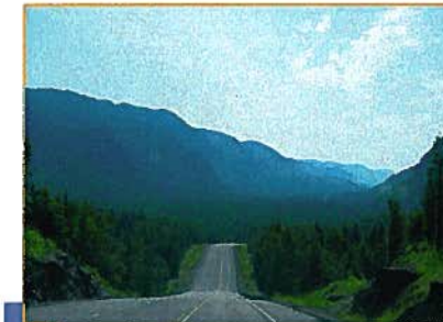
En entrant du côté ouest, on voit apparaître la vallée devant la route 172.