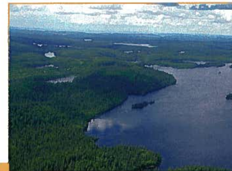
Lac Mandan (M.-A. Bouchard, MDDEP)