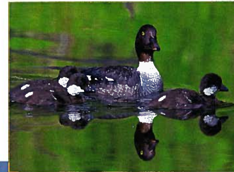
Garrot d'Islande (L. Maste)