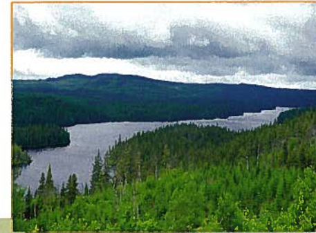
Lac des Huit Chutes