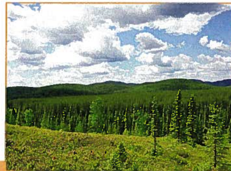
Paysage caractéristique du centre de la réserve