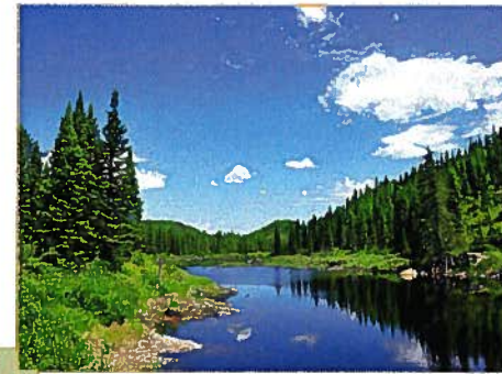
Rivière Pierriche du Milieu (A. R. Bouchard, MDDEP)