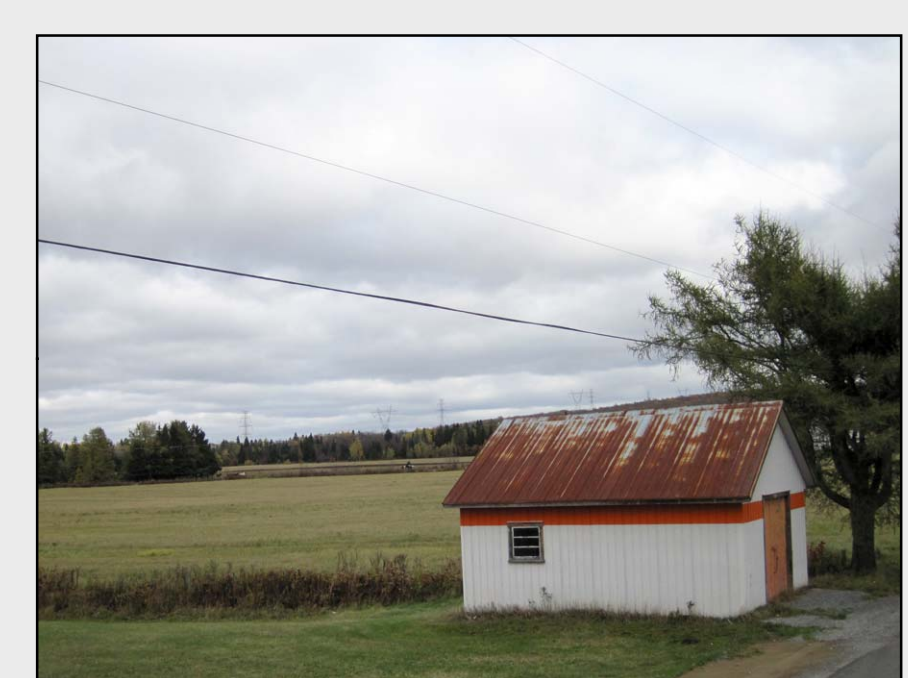
AF3 – Paysage agroforestier du secteur de Pont-Rouge