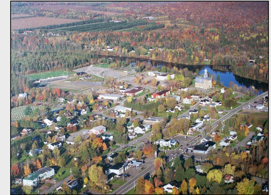
U1 – Paysage urbain de Sainte-Catherine-de-la-Jacques-Cartier