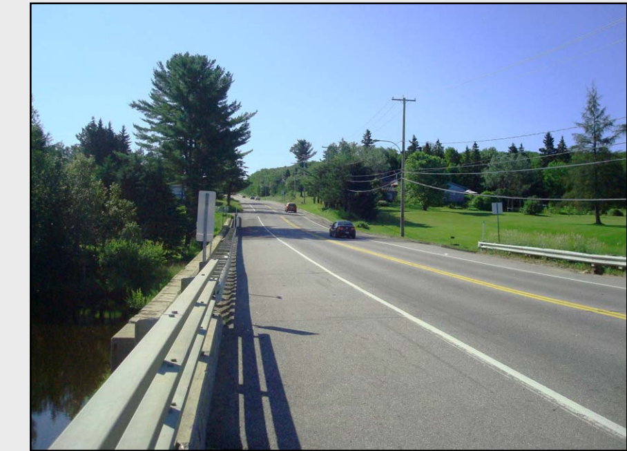
R2 – Paysage rural de la route de Fossambault