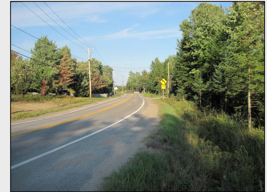
R1 – Paysage rural de la route de la Jacques-Cartier