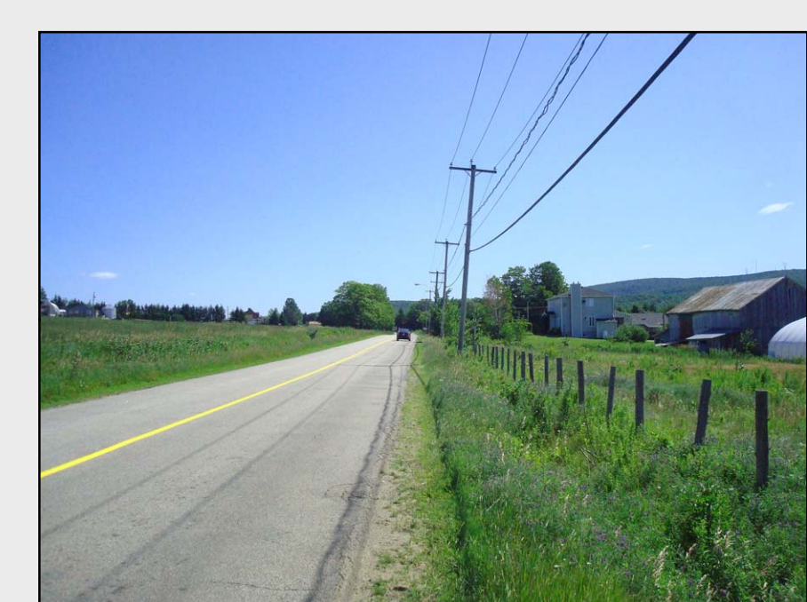
AF4 – Paysage agroforestier de la route des Érables