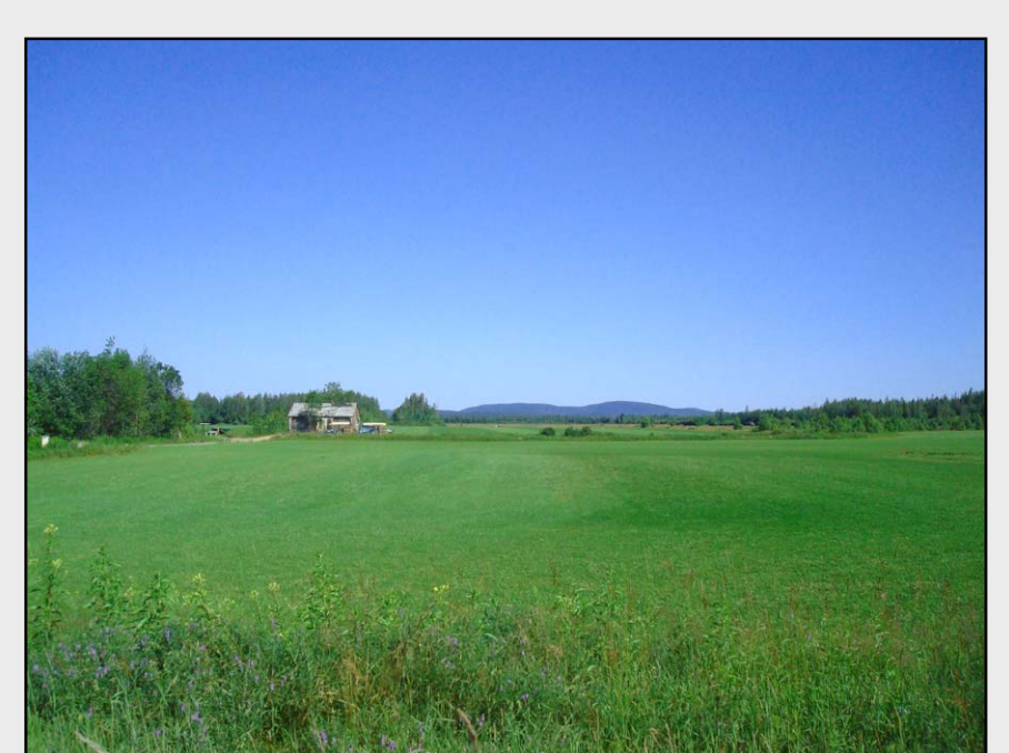
AF2 – Paysage agroforestier de la rue du Grand-Pré