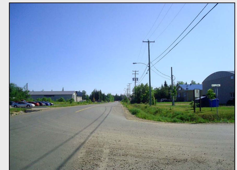
I1 – Paysage industriel de Sainte-Catherine-de-la-Jacques-Cartier