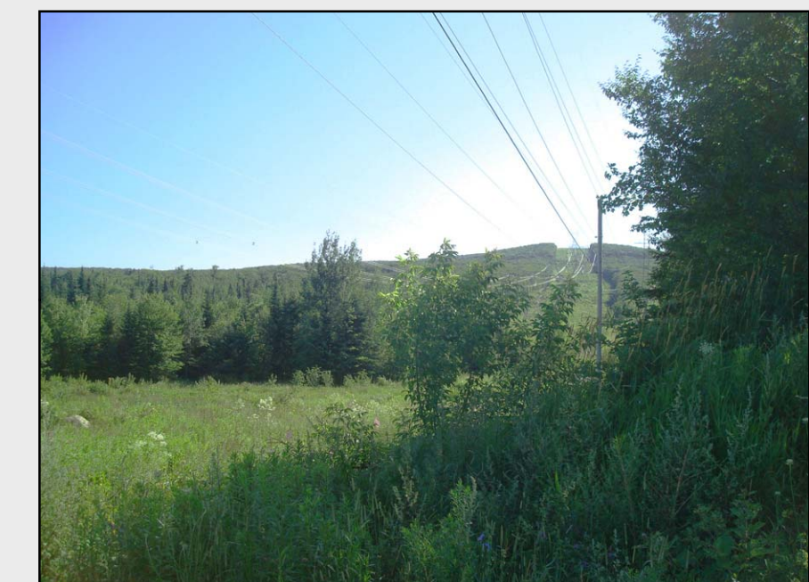
F1 – Paysage forestier des collines du mont Bélair