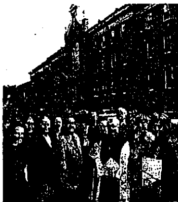
Des membres du comité d'orientation posent ici devant l'Abbaye cistercienne d'Oka.